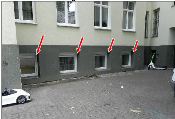
Hoffassade Seitenflügel rechts