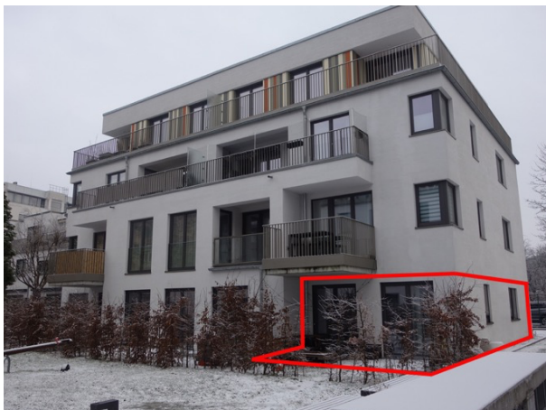
Ansicht Simon-Bolivar-Str. 48 F mit Lage der Wohnung Nr. 3

Sonstiges: keine Einschätzung zur Ausstattung und zu Schäden und Mängeln möglich