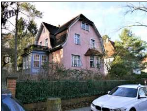
Silvesterweg 9 mit Blick von Nord-Osten