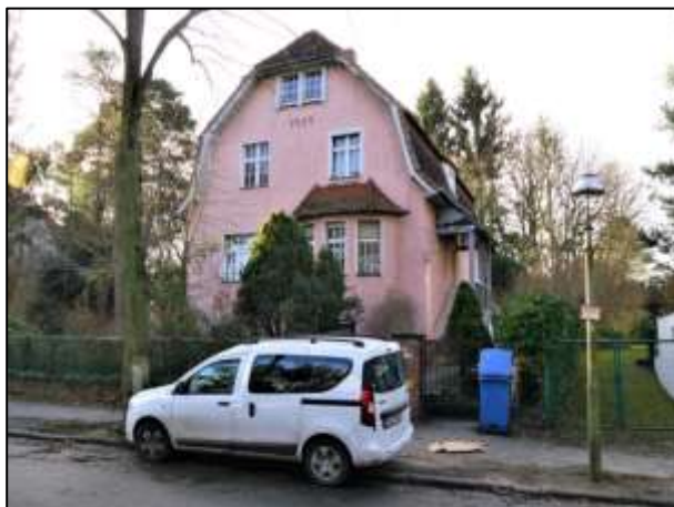
Giebelseite und Eingangsfront (rechts im Bild)