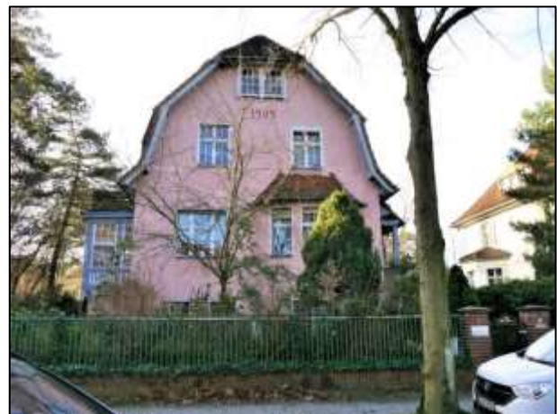
straßenseitiger Giebel des Wohngebäudes