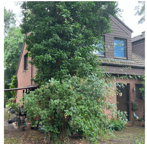
Vorderansicht Doppelhaushälfte Tannenhäherstraße 3C