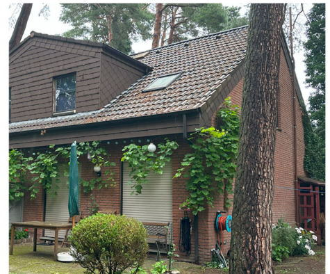
Rückansicht Doppelhaushälfte Tannenhäherstraße 3C