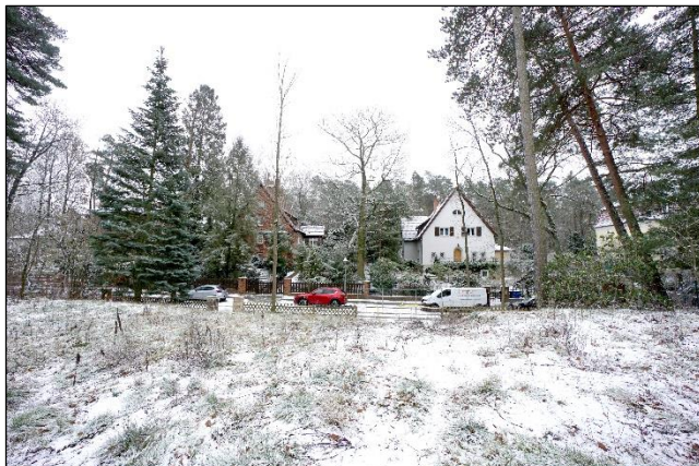
Blick vom Bewertungsgrundstück in Richtung Süden