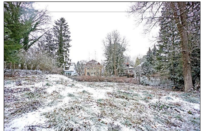
Blick vom Bewertungsgrundstück in Richtung Norden