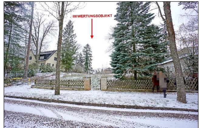
Straßenansicht des Bewertungsobjekts