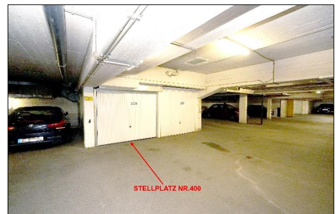
Garageneinstellplatz Nr. 400