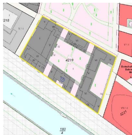
Ausschnitt Katasterkarte, Kennzeichnung Bewertungsgrundstück gelb