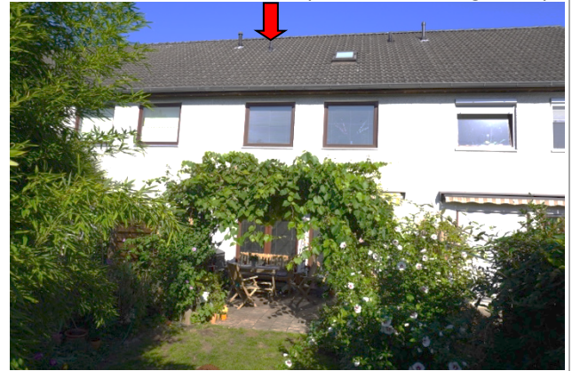
Straßenseite (mit Markierung MEA)