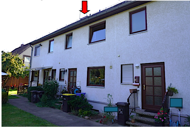
Rückwärtige Ansicht, Hauseingang