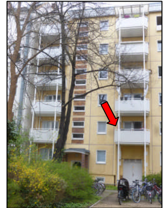
Innenhof - Zugang

Bewertungsort: Corinthstraße 60 10245 Berlin-Friedrichshain Bewertungsobjekt: Wohnung nebst Kellerraum Nr. 3 Objektlage intern: 1. Obergeschoss - rechts (postalisch) Gesamtbebauung: Corinthstr. 60, 62, 64, 66 Markgrafendamm 32 Wohnanlage: 2 Wohnblöcke 5 Gebäudeabschnitte mit Keller 59 Eigentumswohnungen