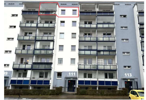
Straßenansicht mit Kennzeichnung WE Nr. 109

Der Verkehrswert des \frac{1}{2} Miteigentumsan- teils an dem unbelasteten Wohnungsei- gentum wurde ermittelt mit 140.000,00 €.