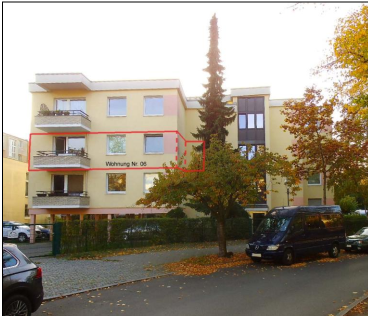
Winterstr. 8 (Lage der Wohnung wurde hinterlegt)