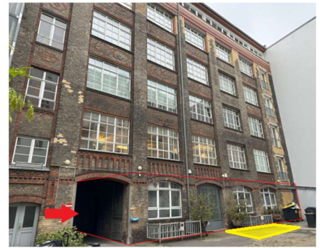
Vorderansicht Fabrikgebäude mit Kennzeichnung Teileigentum Nr. 50 und Sondernutzungsrecht Stellplatz P 12