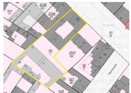
Ausschnitt Katasterkarte, Kennzeichnung Bewertungsgrundstück gelb

Hinweis: Die Verkehrswertermittlung erfolgt auf der Grundlage einer Außenbesichtigung.