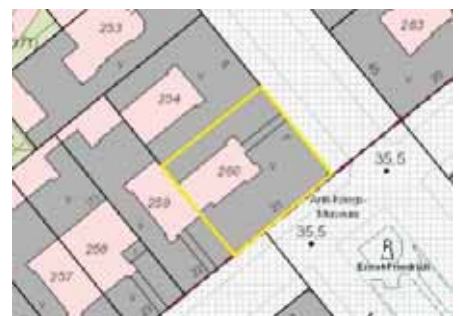
Ausschnitt Katasterkarte, Kennzeichnung Bewertungsgrundstück gelb

Hinweis: Die Verkehrswertermittlung erfolgt auf der Grundlage einer Außenbesichtigung des zu bewertenden Sondereigentums.