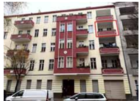
Straßenansicht Lütticher Str. mit Kennzeichnung WE Nr. 31