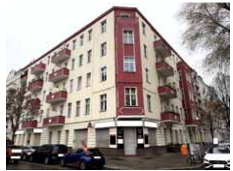
Straßenansicht Brüsseler Str. / Lütticher Str.