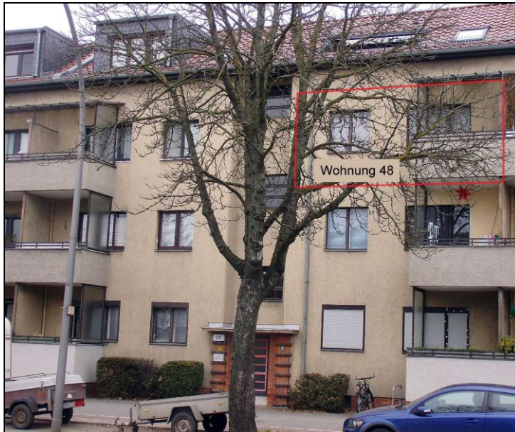
Ansicht Holzhauser Straße 113