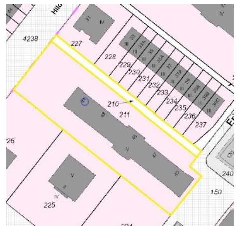
Ausschnitt Katasterkarte, Kennzeichnung Bewertungsgrundstück gelb

Hinweis: Die Verkehrswertermittlung erfolgt auf der Grundlage einer Außenbesichtigung.