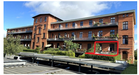
Rückansicht mit Kennzeichnung der Lage des Sondereigentums WE Nr. 8