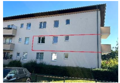
Wilhelm-Gericke-Straße 12 mit Kenn- zeichnung WE Nr. 105