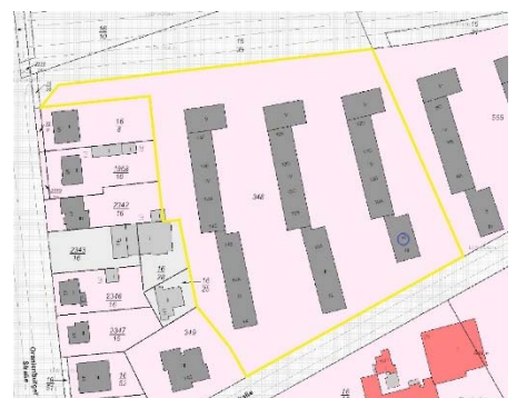
Ausschnitt Katasterkarte, Kennzeich- nung Bewertungsgrundstück gelb