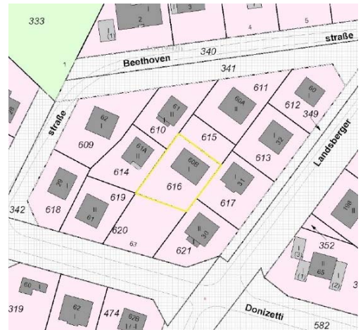
Ausschnitt Katasterkarte, Kennzeichnung Bewertungsgrundstück gelb