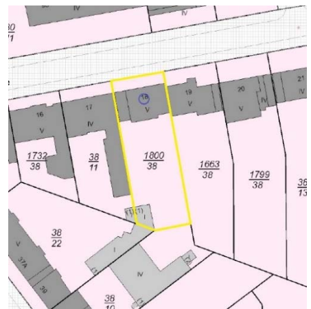
Ausschnitt Katasterkarte, Kennzeichnung Bewertungsgrundstück gelb