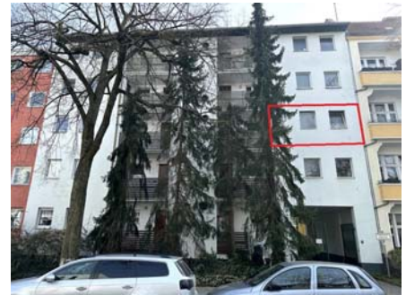
Straßenansicht mit Kennzeichnung Sondereigentum WE 11

105.000,00 € (zum Wertermittlungsstichtag)