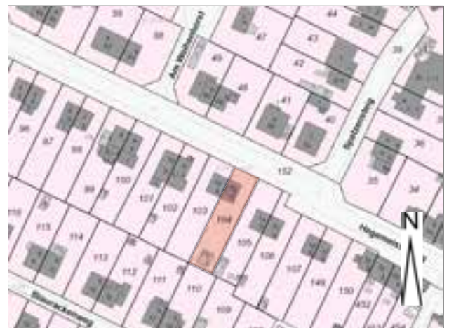
Auszug aus der Flurkarte, Grundstück markiert Straßenperspektive, Blick nach Nord-Ost