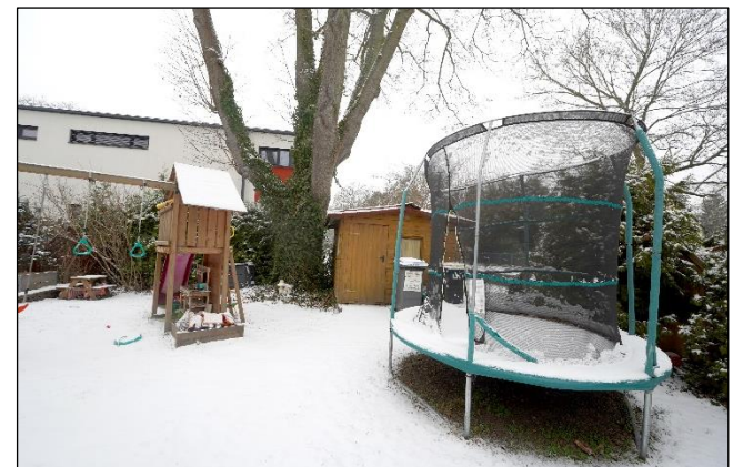
Gartenfläche im Sondernutzungsrecht der Whg.3