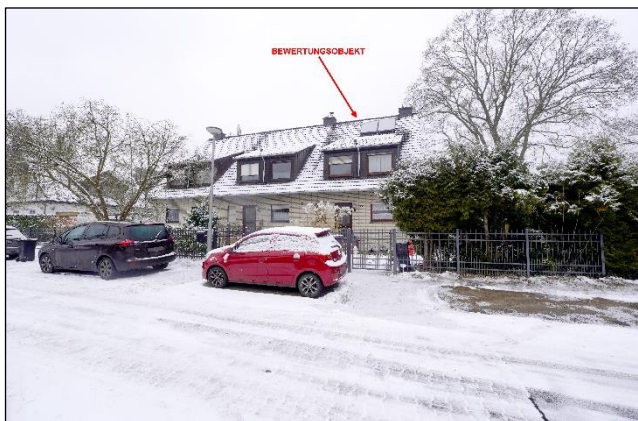
Ansicht von der Turmfalkenstraße