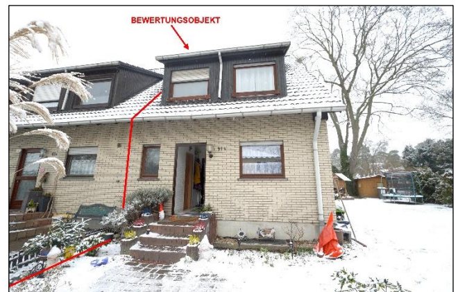
Eingangsseite des Bewertungsobjekts