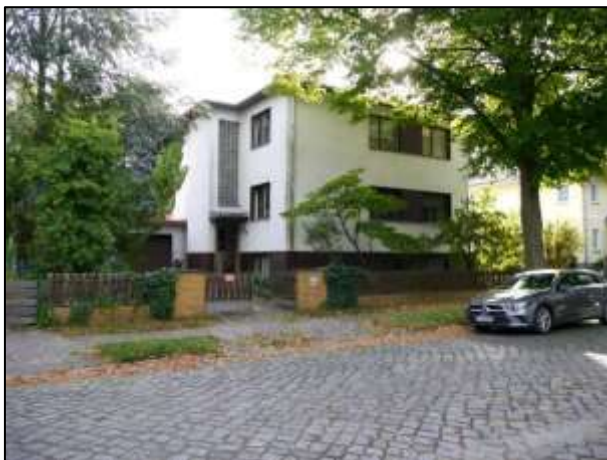
2-Familienhaus a.d. Grdst. Petkuser Str. 3A