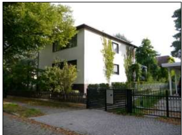
2-Familienhaus a.d. Grdst. Petkuser Str. 3A