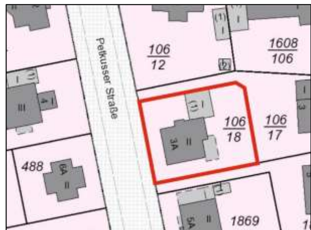
Flurkarte (Grundstück Petkuser Straße 3A)