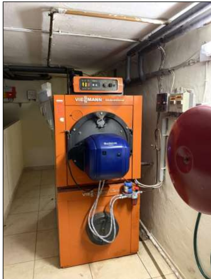
Heizungskeller mit Öl-Heizkessel und Warmwasserspeicher