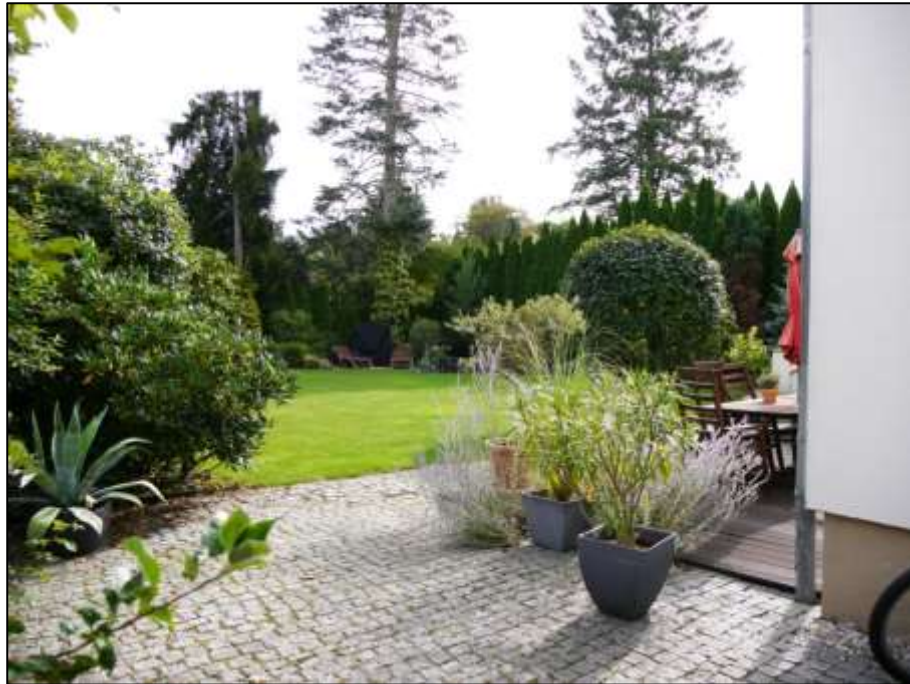
Blick aus dem linken Bauwich in den rückwärtigen Garten des Anwesens mit rechts im Bild unmittelbar hinter dem Einfamilienhaus belegener 1. Terrasse