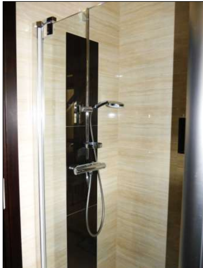
Duschstand im Duschbadezimmer mit Nutzung als Gäste-Toilette im Erdgeschoss als Hochparterre des Einfamilienhauses