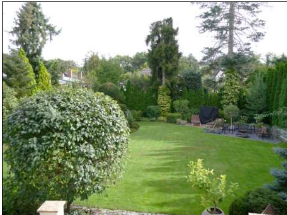
Blick von der Freitreppe in den rückwärtigen Garten des Anwesens mit in der östlichen Grundstücksecke belegener in das Terrain eingesenkter 2. Gartenterrasse und links daneben ebenerdiger 3. Terrasse