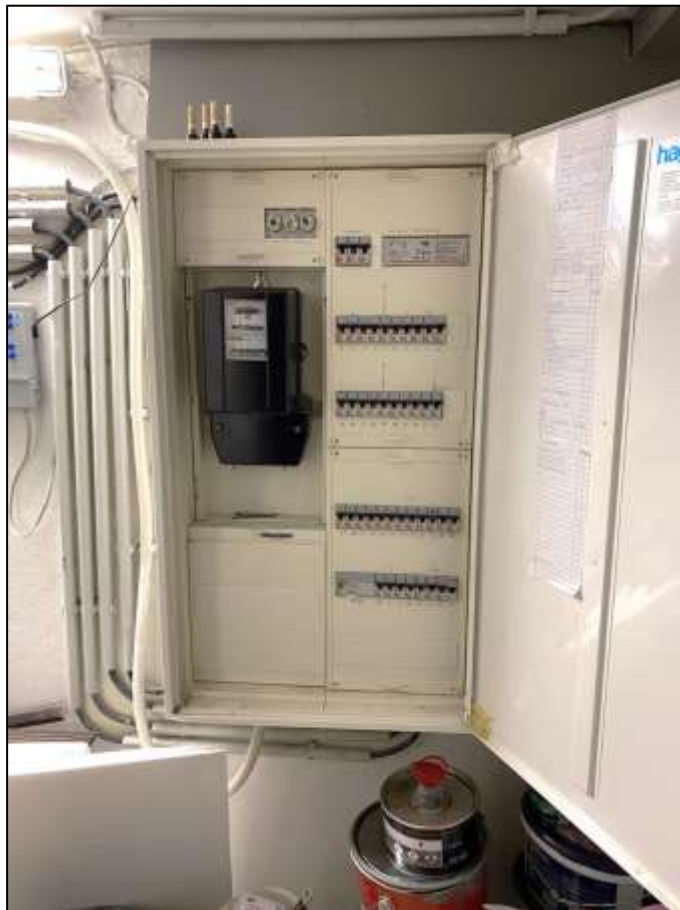
Sicherungstabelle im Hausanschlussraum mit Sicherungsautomaten und Drehstromzähler