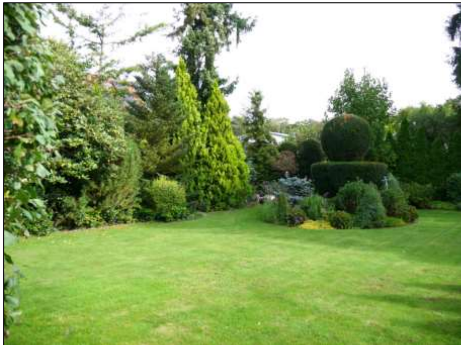
Blick nach Nord-Osten in den Garten des Anwesens mit vor der nördlichen Grundstücksecke belegener immergrüner bzw. winterharter Ziergarten-Vegetation mit Formschnitt der Buchsbäume bzw. Lebensbäume o.ä. als Kegel und Kugel etc.