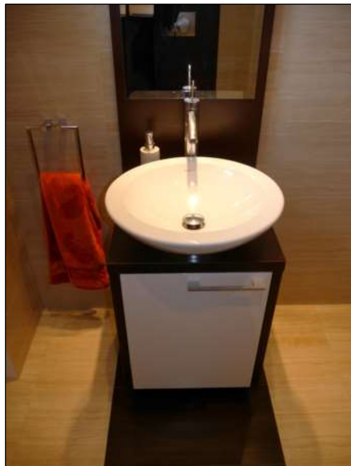
Handwaschbe- cken im Dusch- badezimmer im Erdgeschoss bzw. Hochpar- terre des Ein- familienhauses mit Nutzung als Gäste-Toilette