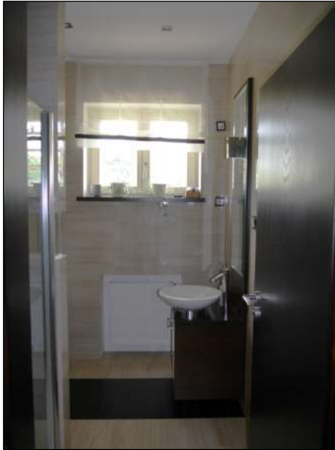
Duschbadezimmer mit Nutzung als Gäste-Toilette im Hochparterre des Einfamilienhauses