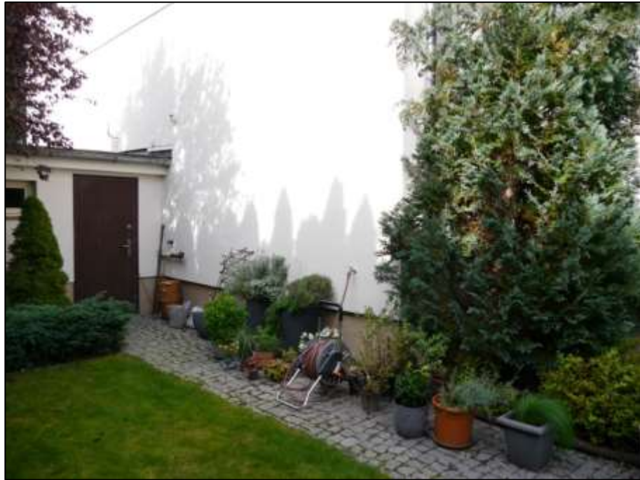
Blick aus dem rechten Bauwich auf die süd-östliche Front des Einfamilienhauses mit anbindender gartenseitiger Front des Garagen-Anbaus als Doppelgarage mit rückwärtigem Türzugang und Zuwegung