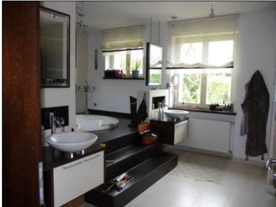
Badezimmer mit getrennten Handwaschbecken sowie Differenzterruppe zur Podestfläche mit hierin integriertem Whirlpool im Obergeschoss des Einfamilienhauses