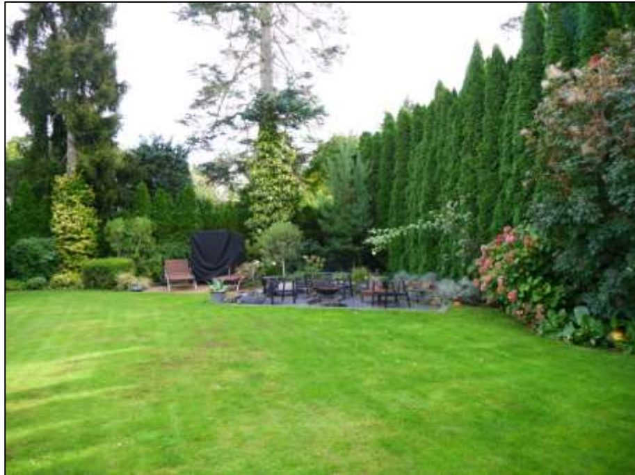
Blick nach Nord-Osten in den Garten des Anwesens mit in der östlichen Grundstücksecke belegener in das Terrain eingesenkter 2. Gartenterrasse und links daneben ebenerdiger 3. Terrasse