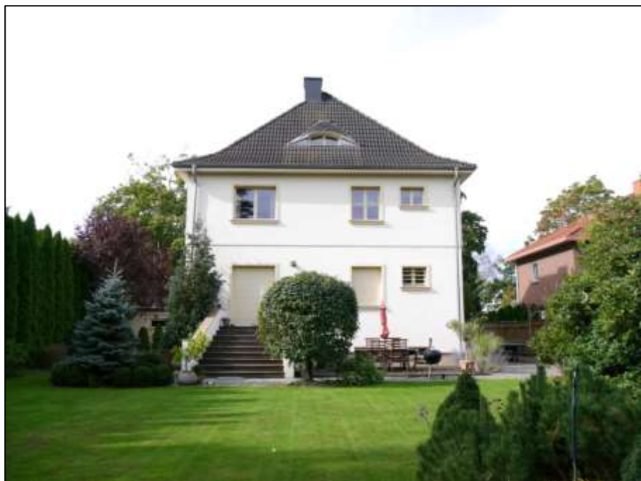
Blick aus dem rückwärtigen Garten des Anwesens auf das auf dem Grundstück Seydlitzstraße 29 aufstehende Einfamilienhaus mit Freitreppe und Terrasse vor der gartenseitigen Gebäudefront