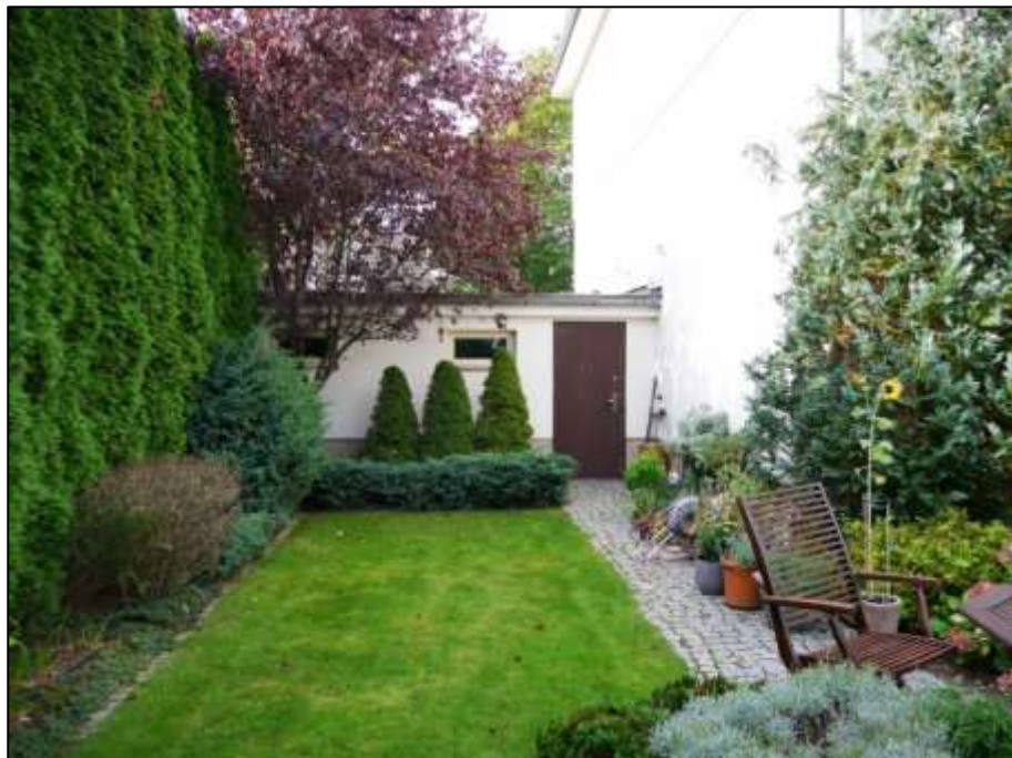
Blick aus dem rückwärtigen Garten im Bereich der 4. Gartenterrasse in den rechten Bauwich mit aufgehender süd-östlicher Front des Einfamilienhauses und anbindender gartenseitiger Front des Garagen-Anbaus als Doppelgarage mit rückwärtigem Türzugang und Zuwegung