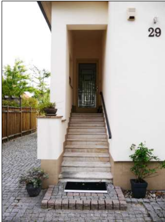
Hauseingangsvorbau mit gedeckter Außen- treppe zum Windfangvor- bau im linken Bauwich des Einfamilienhau- ses