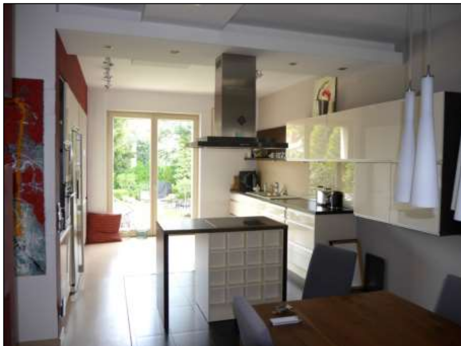
zum Wohnzimmer offener Küchenbereich im Wohn-/Esszimmer im Hochparterre des Einfamilienhauses mit sogen. Kücheninsel