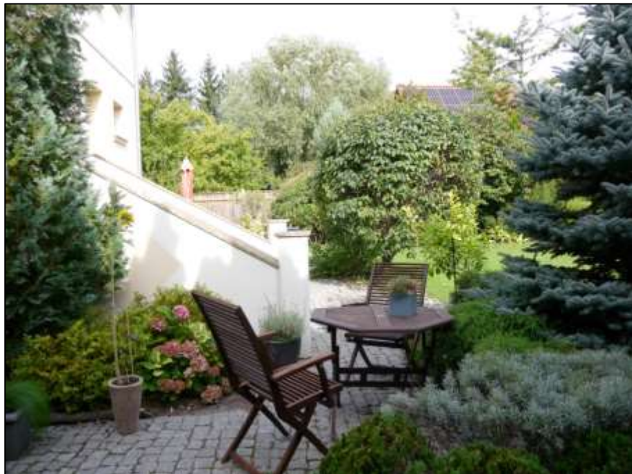
4. Gartenterrasse auf dem Anwesen links neben der Freitreppe vor der gartenseitigen Gebäudefront