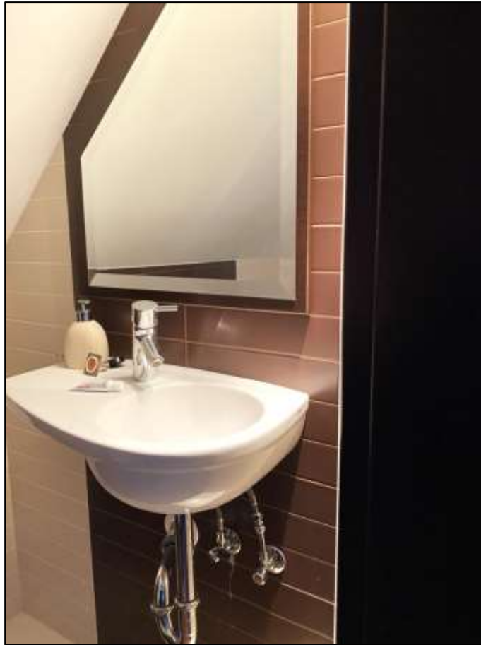
Handwaschbecken im innenliegenden motorisch belüfteten Toilettenraum im Dachraumausbau