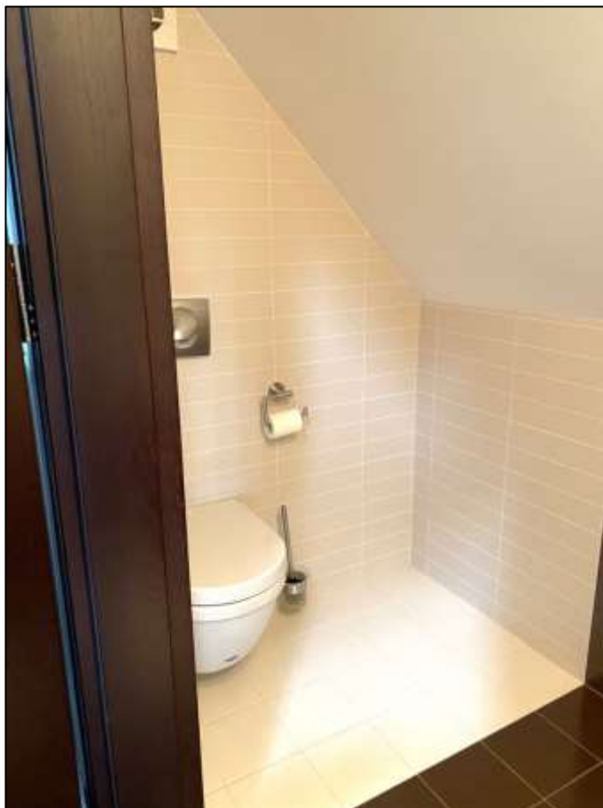
wandhängendes WC-Becken im innenliegenden motorisch belüfteten Toilettenraum im Dachraumausbau