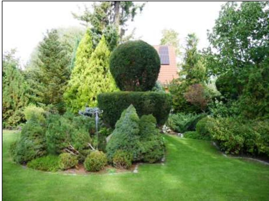
Blick in den Garten im Bereich der nördlichen Grundstücksecke mit Ziergarteninsel u.a. mit immergrüner bzw. winterharter Baum- und Buschvegetation mit Formschnitt der Buchsbäume bzw. Lebensbäume o.ä. als Kegel und Kugel etc.