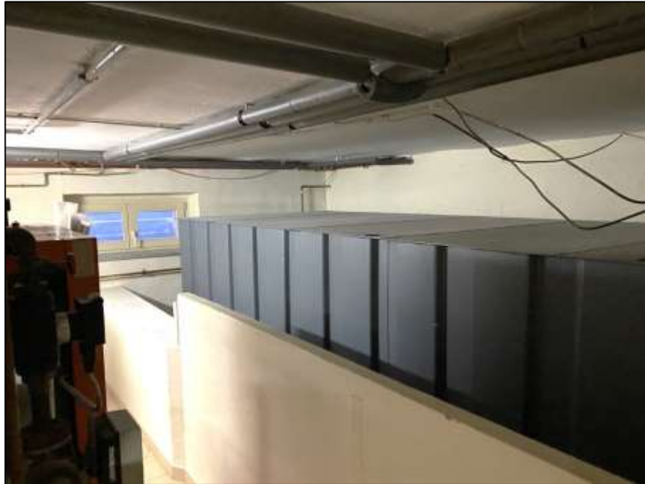
kellergeschweißter Stahltank mit Öl-Auslaufwanne und Heizkessel links im Bild