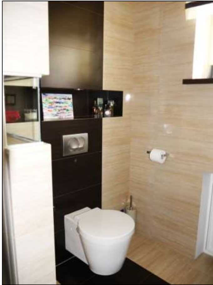
Toilettenbecken im Duschbade- zimmer im Erd- geschoss bzw. Hochparterre des Einfamilien- hauses mit Nut- zung als Gäste- Toilette