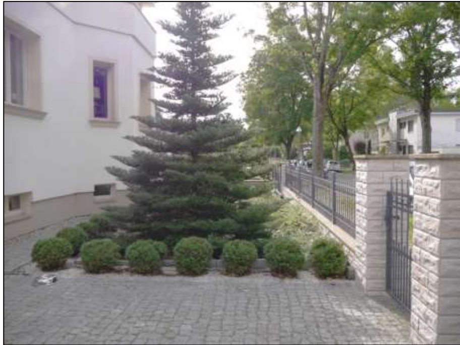
Blick aus dem Bereich der Stellplatzzufahrt und der Hauszuwegung im linken Bauwich auf den Vorgarten des Anwesens