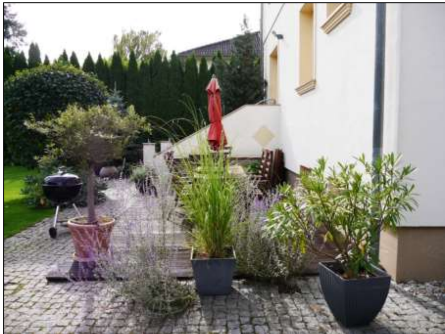
unmittelbar hinter dem Einfamilienhaus belegener 1. Terrasse auf dem Grundstück Seydlitzstr. 29