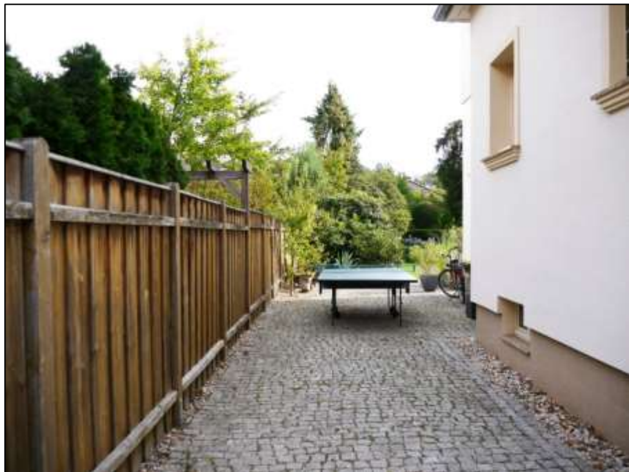
Blick aus dem linken Bauwich in die Durchwegung zum rückwärtigen Garten des Anwesens