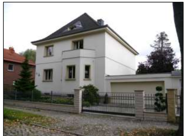
straßenseitige Gebäudefront mit Garage