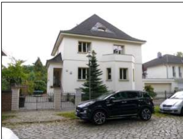
straßenseitige Gebäudefront mit Hauseingang