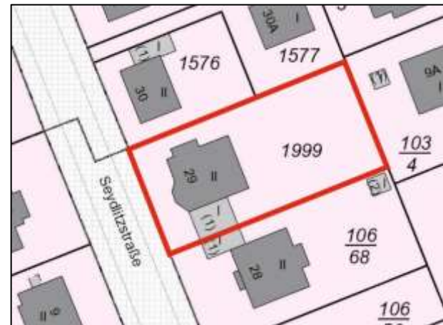
Flurkarte (Grundstück Seydlitzstraße 29)