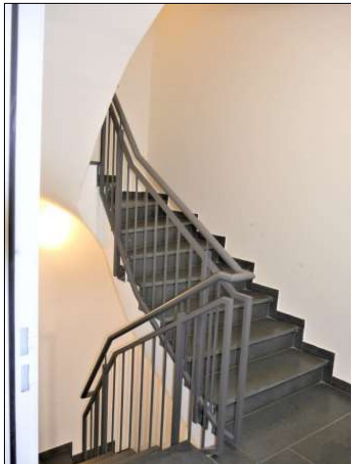
Blick aus der an den Hauseingangsbereich des Neubau-Seitentraktes anbindenden Schleuse in das innenliegende Treppenhaus