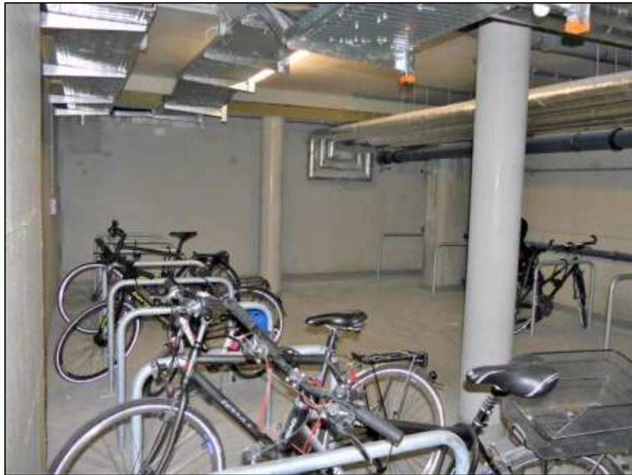
Fahrradkeller im Neubau-Vorderhaus