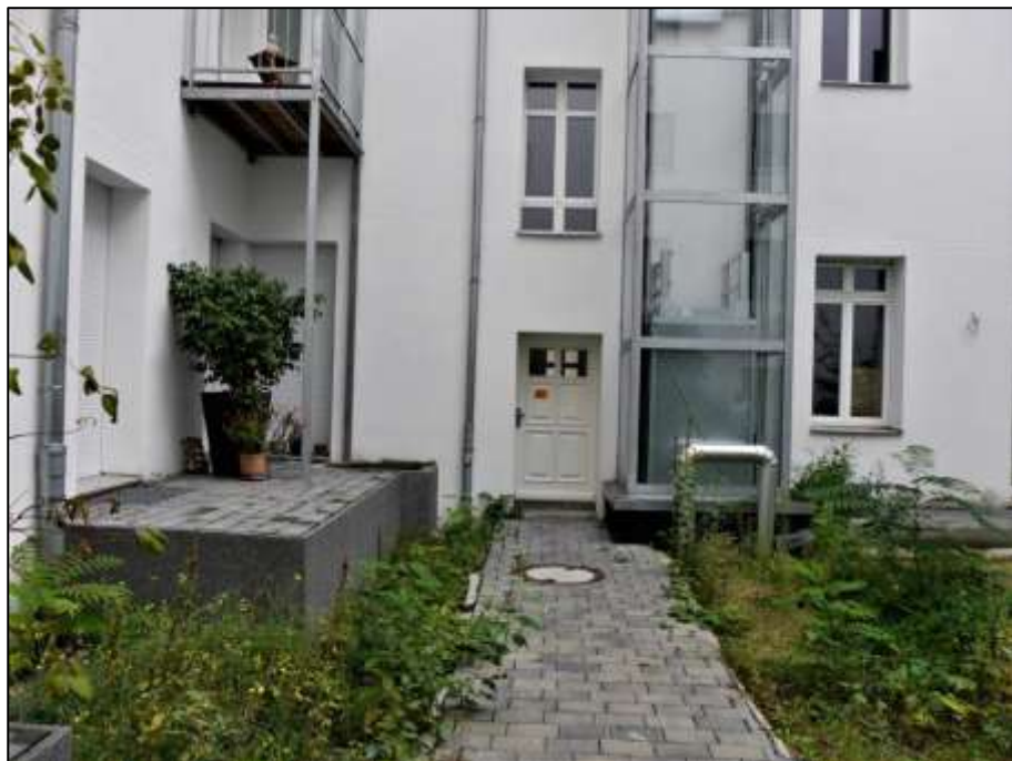
Hofzuwegung mit hofseitigem Hauseingang des Altbau-Vorderhauses