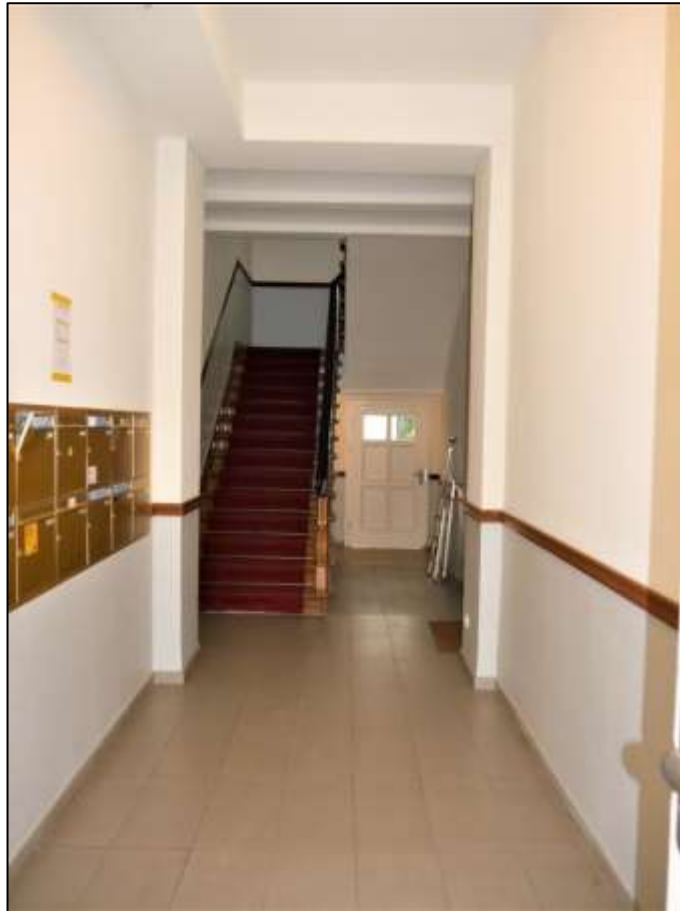
Hauseingangsbereich des Altbau-Vorderhauses