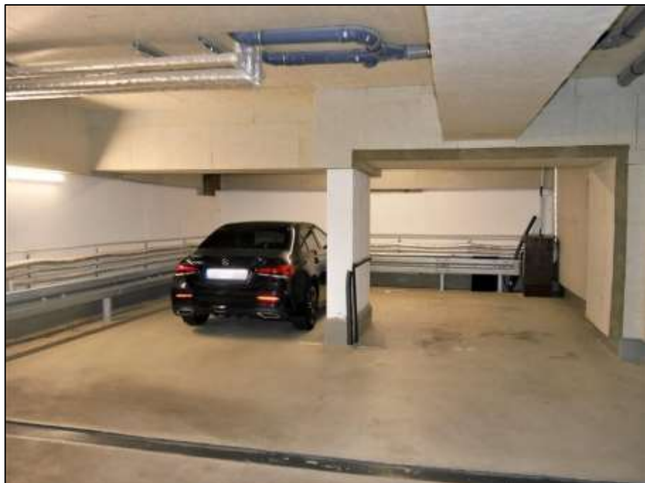
Tiefgaragenbereich unterhalb des Neubau-Seitentraktes neben dem innenliegenden Treppenhaus des Neubau-Seitentraktes vor der rückwärtigen Gebäudefront