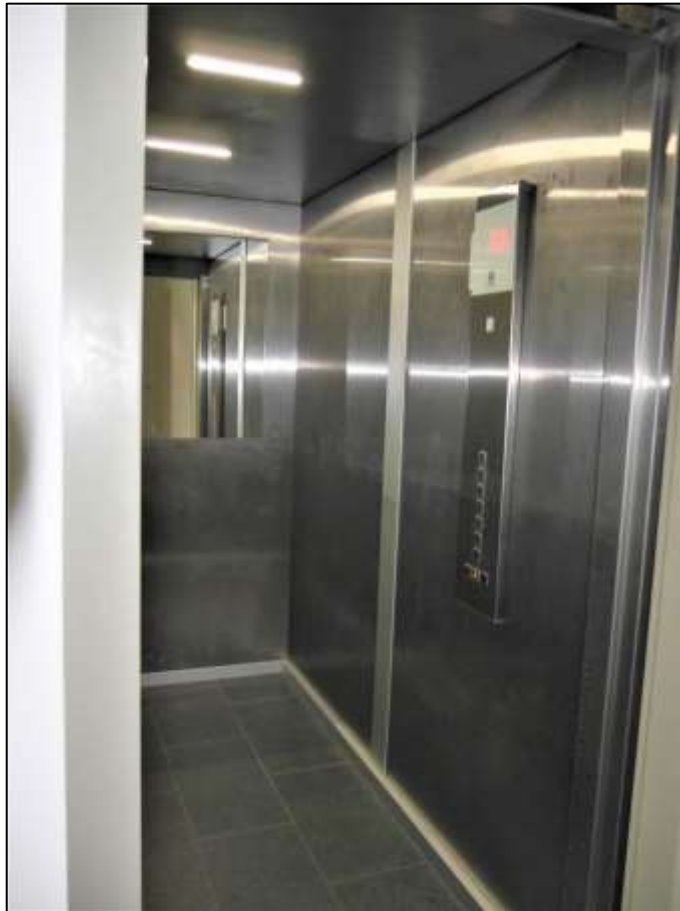
Aufzugskabine der Aufzugsan- lage im Neu- bau-Seitentrakt