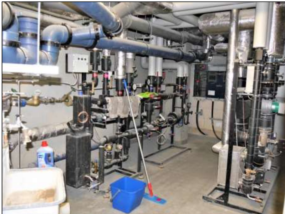
Heizungskeller mit Wärmetauscherstation im Neubau-Vorderhaus