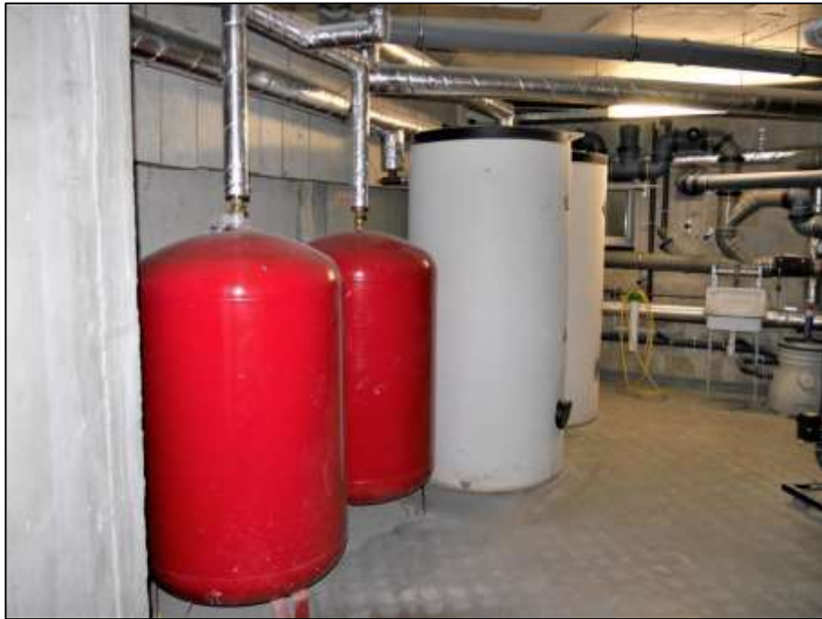
Heizungskeller mit Wärmetauscherstation im Neubau-Vorderhaus und Warmwasserspeichern der zentralen Warmwasserversorgung