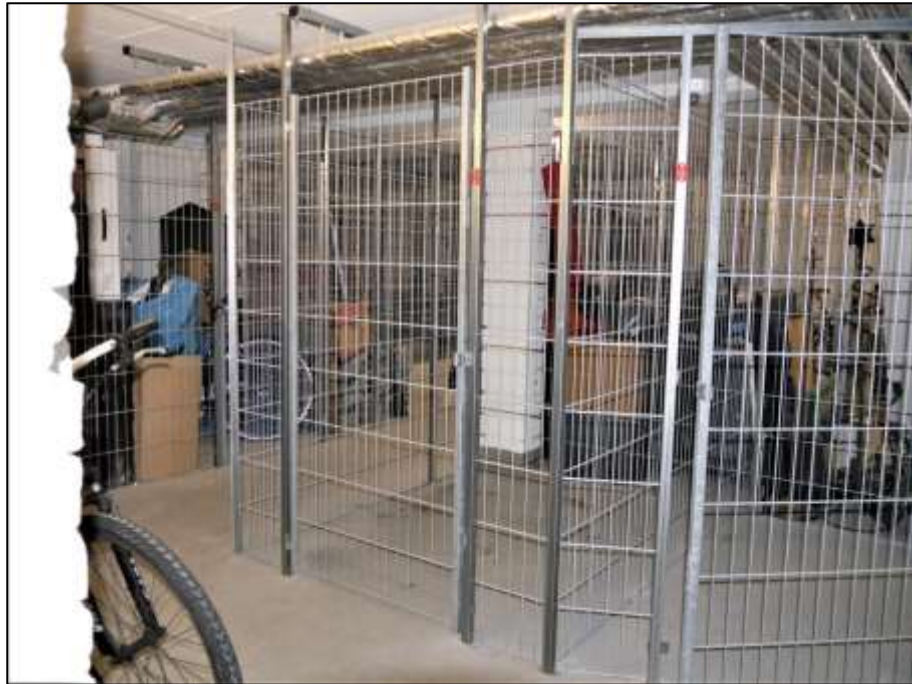
Stabmattenboxen als Abstellkeller der Wohnungseigentume im Altbau-Vorderhaus