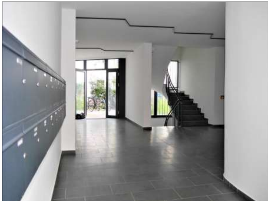
Hauseingangsbereich im Neubau-Vorderhaus mit Blick auf die hofseitige Hauseingangstür und das anbindende Treppenhaus