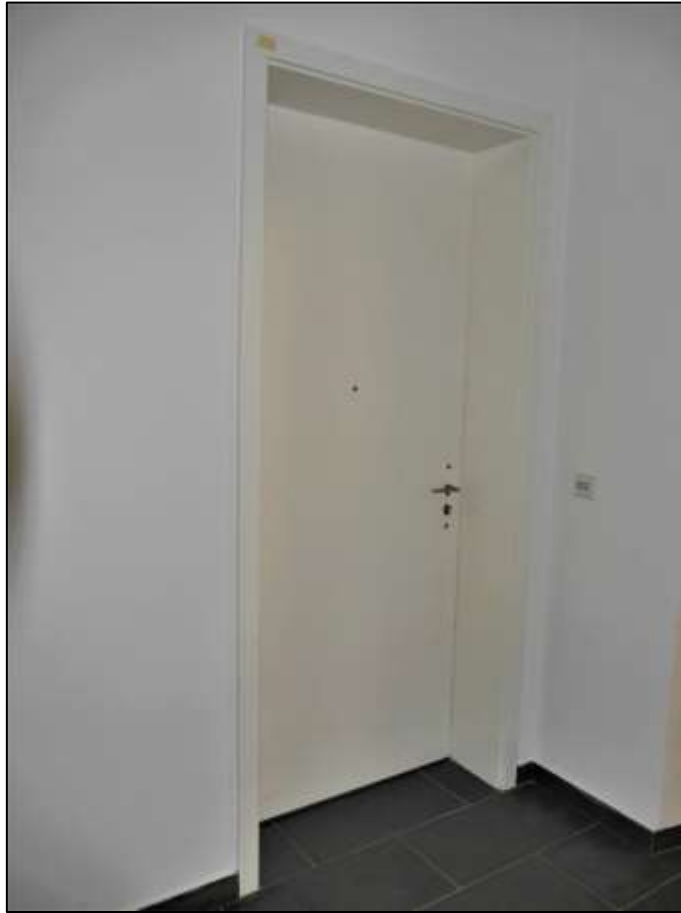
Eingangstür des Wohnungseigentums Nr. 42 im Erdgeschoss postalisch hinten links im Neubau-Seitentrakt