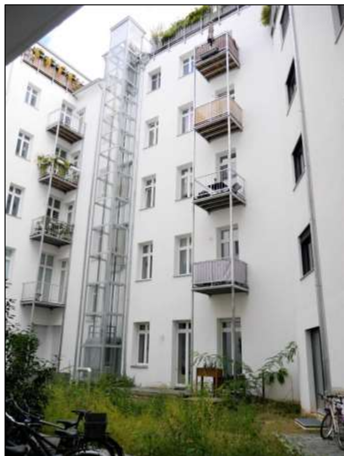
Blick auf die hofseitige Front des Altbau-Vor- derhauses mit anbindendem Altbau-Seiten- flügel