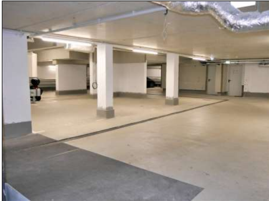
Blick aus dem Bereich der Rampen-Ein- und Ausfahrt zur Auerstraße in die Tiefgarage