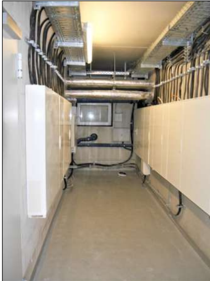
Hausanschluss- und Stromzäh- lerraum im Neubau-Vor- derhaus