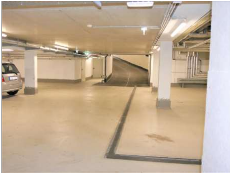
Blick aus der Schleuse in die Tiefgarage mit Rampen-Ein- und Ausfahrt zur Auerstraße im Hintergrund