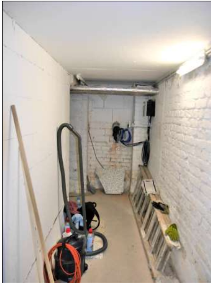
Abstellkeller des Hausmeis- ters im Altbau- Vorderhaus