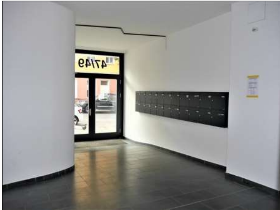
Hauseingangsbereich im Neubau-Vorderhaus mit Blick auf die straßenseitige Hauseingangstür