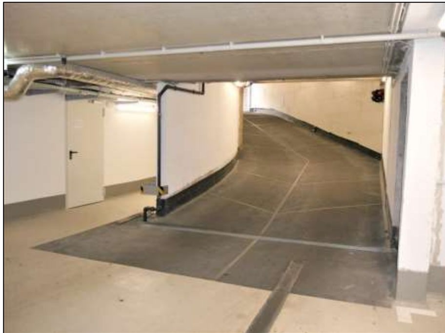
Blick aus der Tiefgarage unterhalb des Neubau-Vorderhauses auf die Rampen-Ein- und Ausfahrt zur Auerstraße