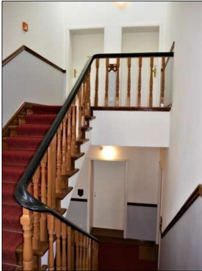
Treppenhaus- kopf des Alt- bau-Vorder- hauses