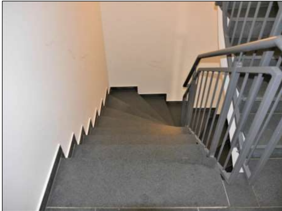
offener Kellertreppenabgang des innenliegenden Treppenhauses im Neubau-Seitentrakt zur Kellerschleuse der Tiefgarage