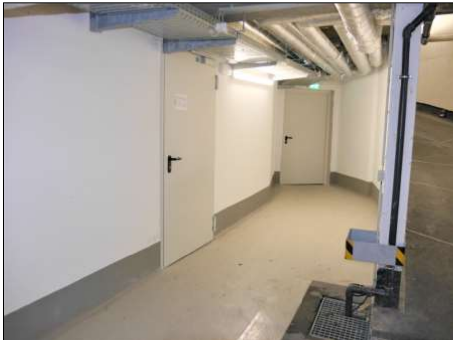
neben der Rampen-Ein- und Ausfahrt zur Auerstraße belegene Technikräume mit Zugang aus der Tiefgarage