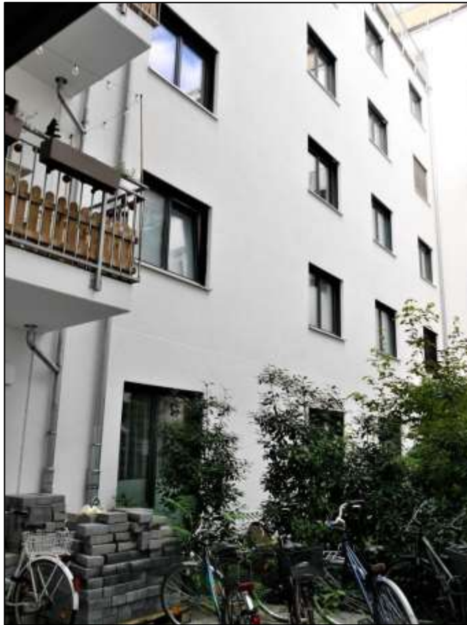
zum Innenhof orientierte Front des Neubau- Seitentraktes