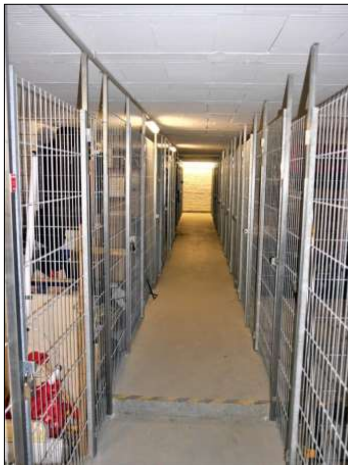
Stabmattenboxen als Abstellkeller der Wohnungseigentume im Altbau-Vorderhaus