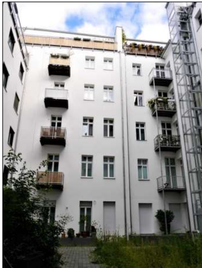
Blick auf den Altbau-Seiten- flügel mit Neu- bau-Seiten- trakt links und Alt- bau-Vorder- haus rechts im Bild