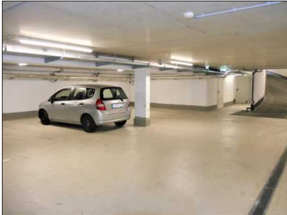
Tiefgaragenbereich als Hofunterkellerung mit anbindenden Technikräumen im Hintergrund neben der Rampen-Ein- und Ausfahrt zur Auerstraße