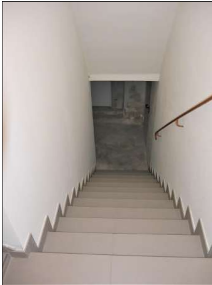
eingehauster Kellertreppen- abgang im Alt- bau-Vorder- haus