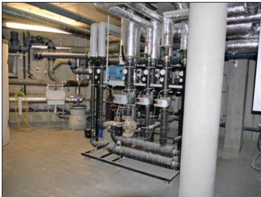
Heizungskeller mit Wärmetauscherstation im Neubau-Vorderhaus