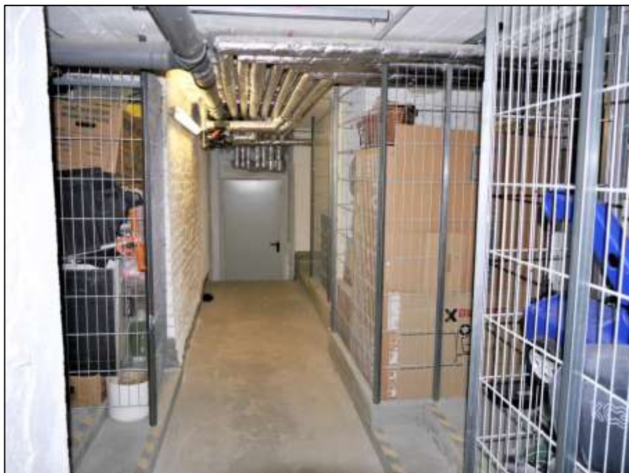
Stabmattenboxen als Abstellkeller der Wohnungseigentume im Altbau- Vorderhaus mit Durchgang zum Neubau-Vorderhaus