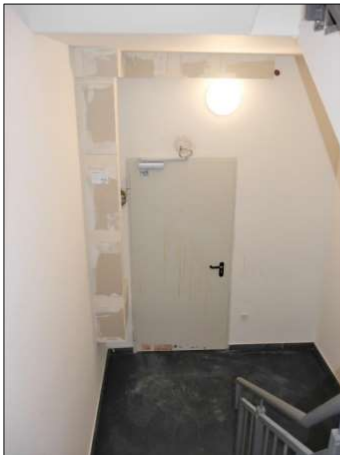
Treppenaustritt des Kellertreppenabgangs in dem innenliegenden Treppenhaus im Neubau-Seitentrakt mit anbindender Schleuse zur Tiefgarage