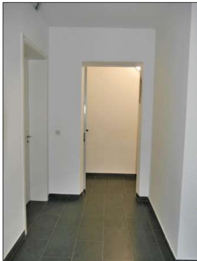
Hauseingangs- bereich des Neubau-Seiten- traktes mit an- bindender Schleuse zu dem innenlie- genden Trep- penhaus