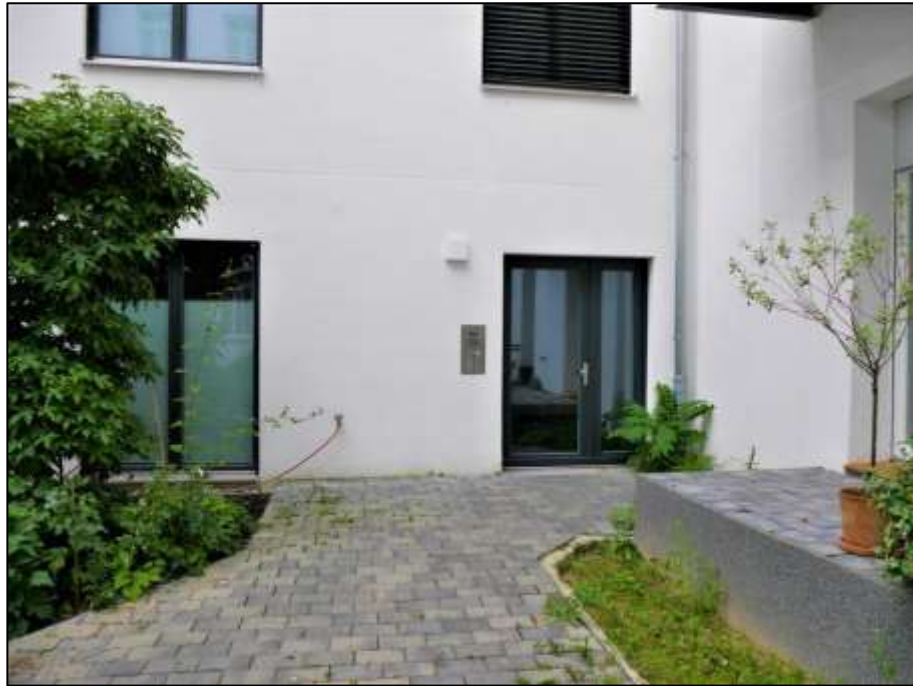
Hofzuwegung mit hofseitigem Hauseingang des Neubau-Seitentraktes