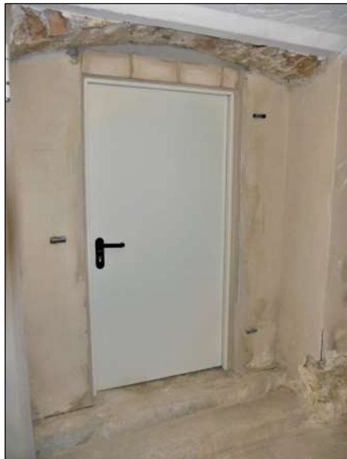
Zugangstür zu den Kellerab- stellverschlägen im Altbau-Vor- derhaus