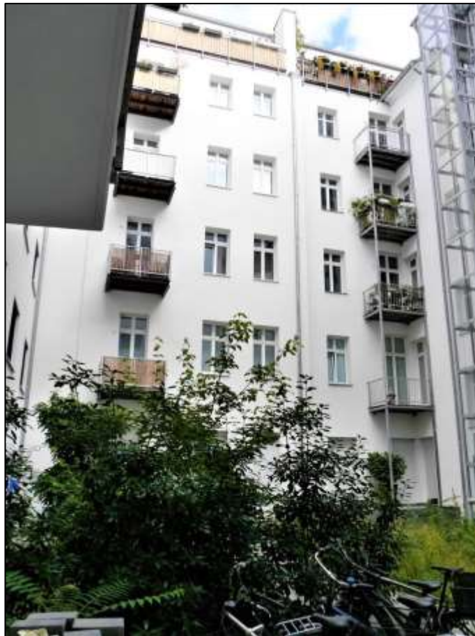
Blick auf den Altbau-Seiten- flügel mit Neu- bau-Seitentrakt links und Alt- bau-Vorder- haus rechts im Bild