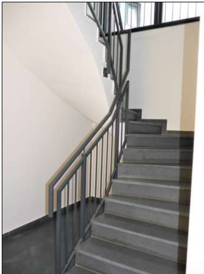
aus dem Keller aufgehende Treppe im Neu- bau-Vorder- haus