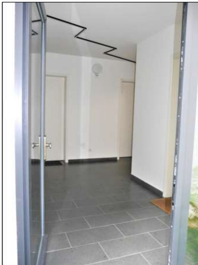
Hauseingangsbereich des Neubau-Seiten- traktes