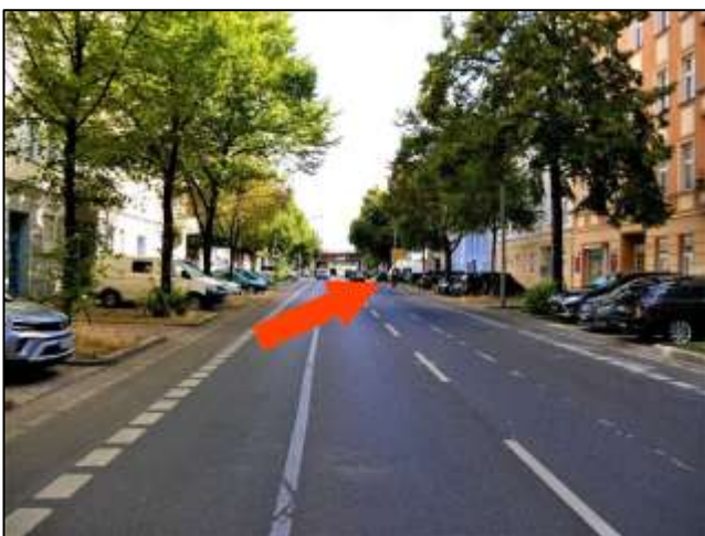
Blick in die Gürtelstraße von Süd-Westen