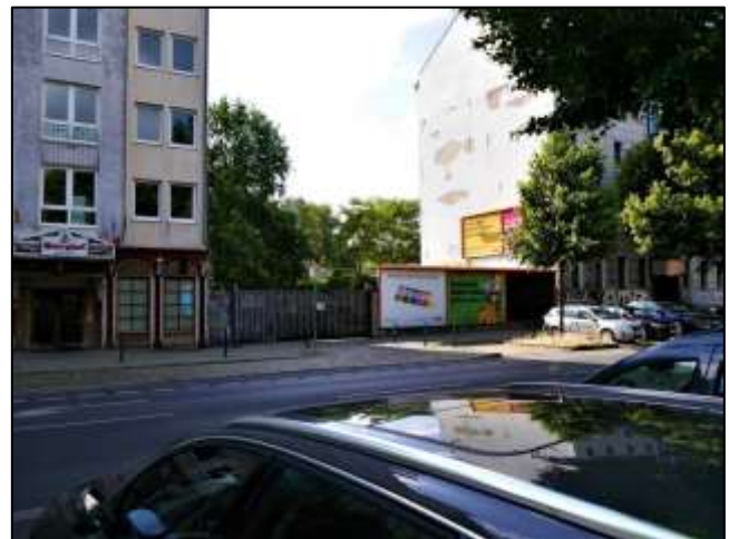
straßenseitige Front des Grdst. Gürtelstr. 40