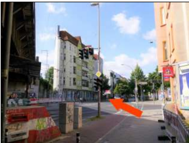
Blick in die Gürtelstraße von Nord-Osten