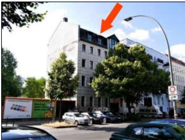
Vorderhaus Gürtelstr. 39 (freie Giebelseite)