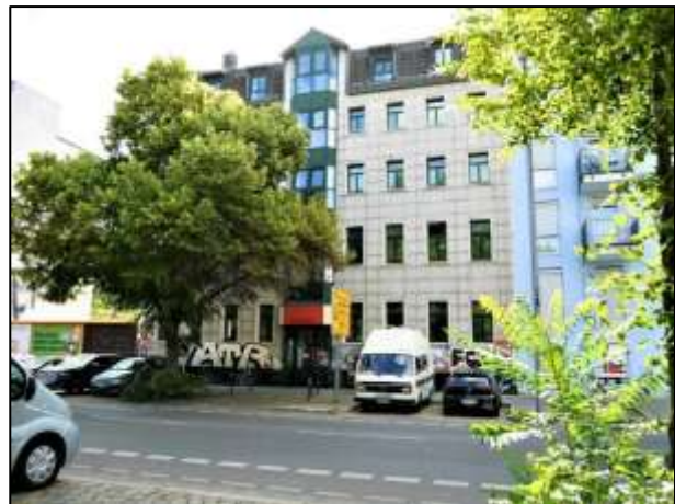
Vorderhaus Gürtelstr. 39 (Straßenfront)