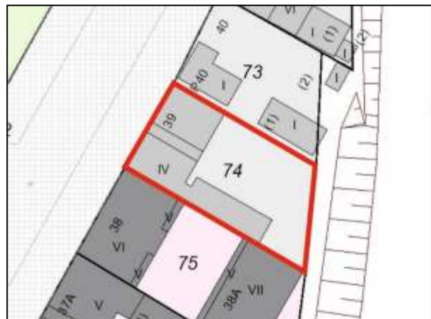
Flurkarte (Grundstück Gürtelstraße 39)