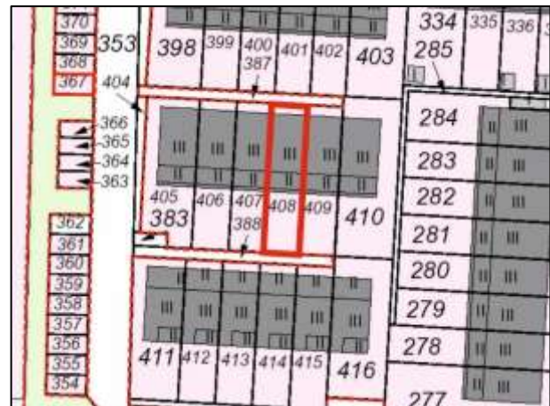
Flurkarte mit EFRH-Grdst. u. Garagen-Grdst.