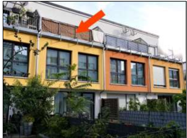
Gartenfront des EFRH Freiesienweg 20 (Hs4)