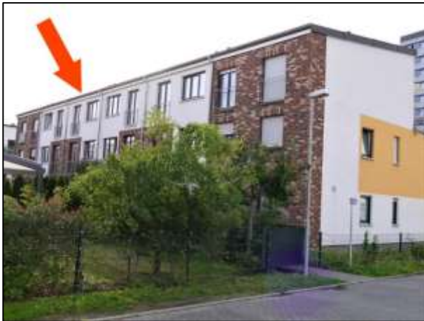
Einfamilienreihenhauszeile mit Haus 4