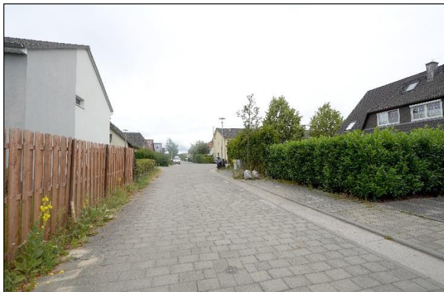
Blick entlang der Marga-von-Etzdorf-Straße