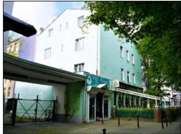
Gebäude Alt-Tempelhof 61, 69