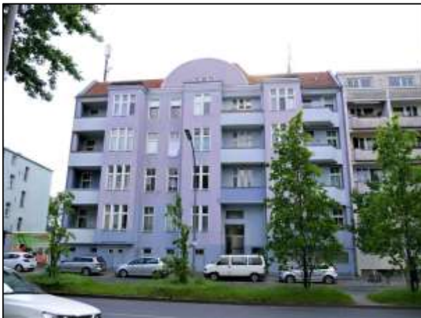
Gebäude Manteuffelstraße 68