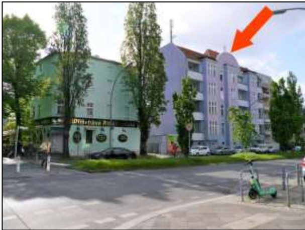
Grdst. Alt-Tempelhof 61, Manteuffelstr. 68, 69