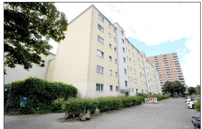
Nordostansicht / Eingangsseite