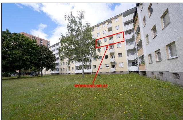
Südansicht / Hofseite