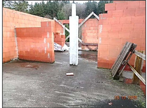
Rohbau Fl.Nr. 259/6 – OG