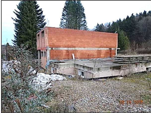
Rohbau Fl.Nr. 259/6 und 259/7