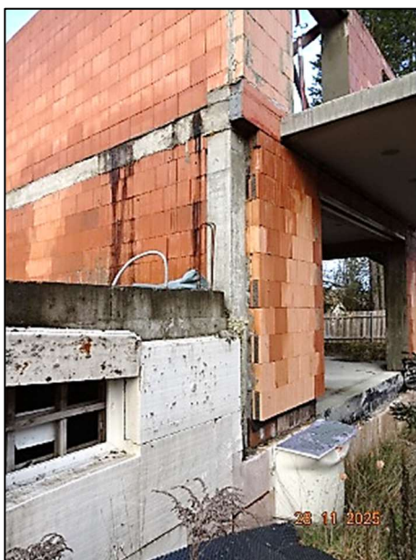
Rohbau Fl.Nr. 259/6 und Fl.Nr. 259/7