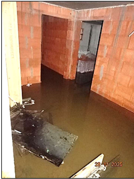
Rohbau Fl.Nr. 259/6 – KG ca. 30 cm Wasser