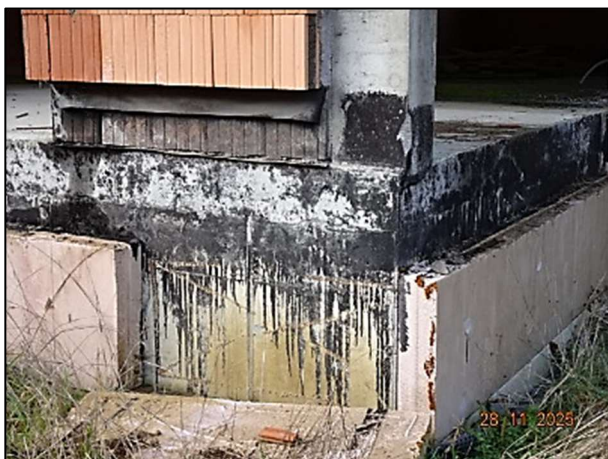
Rohbau Fl.Nr. 259/6 – Gebäudeecke EG