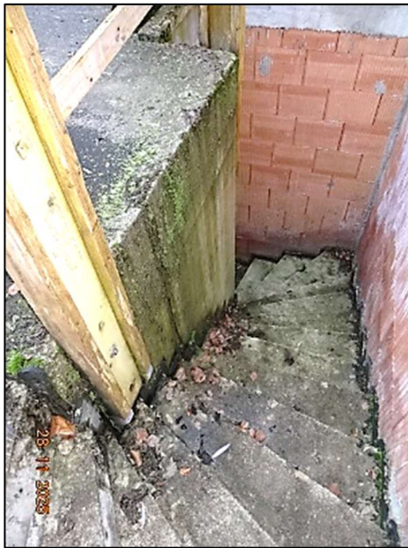
Rohbau Fl.Nr. 259/6 – Treppe