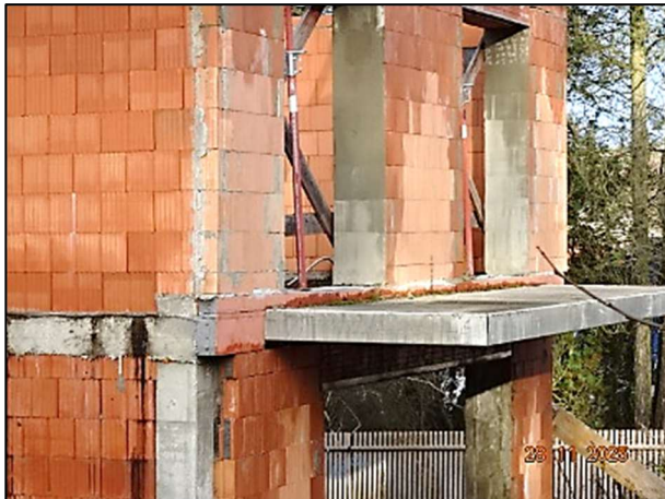
Rohbau Fl.Nr. 259/6