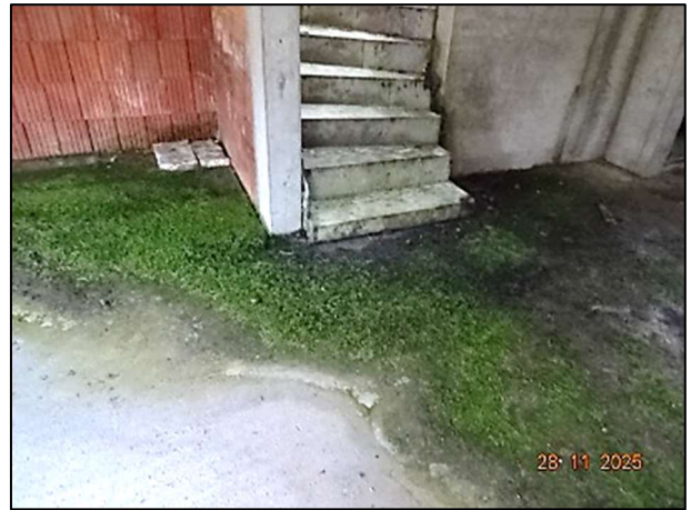
Rohbau Fl.Nr. 259/6 – EG, Nässe und Moosbildung