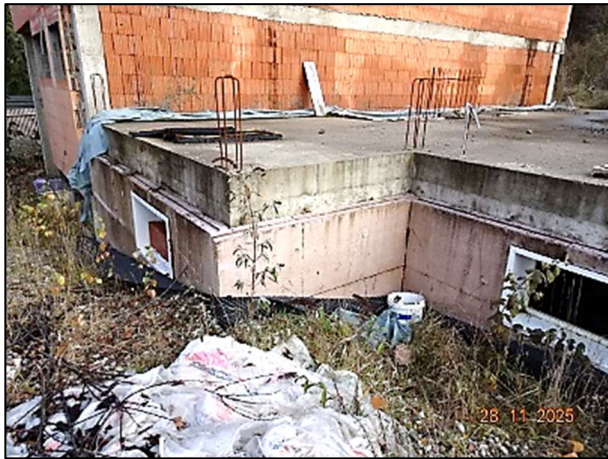
Rohbau Fl.Nr. 259/6 und Fl.Nr. 259/7