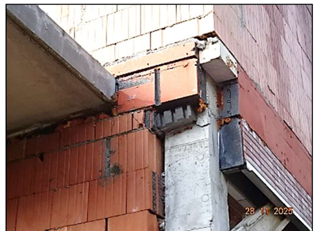
Rohbau Fl.Nr. 259/6 – Gebäudeecke OG