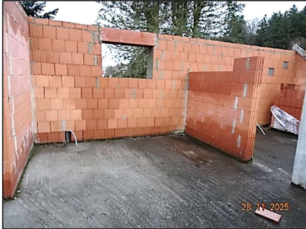
Rohbau Fl.Nr. 259/6 – OG