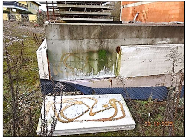
Rohbau Fl.Nr. 259/7