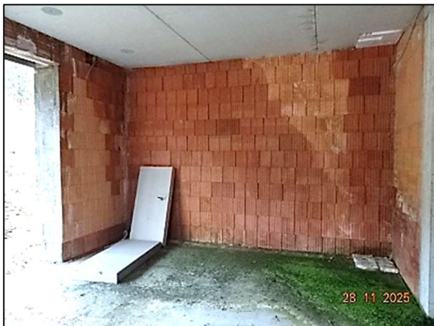
Rohbau Fl.Nr. 259/6 – EG