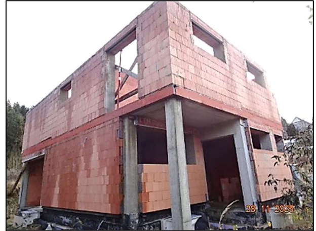
Rohbau Fl.Nr. 259/6