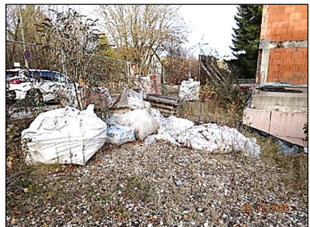
Müll vor Rohbau