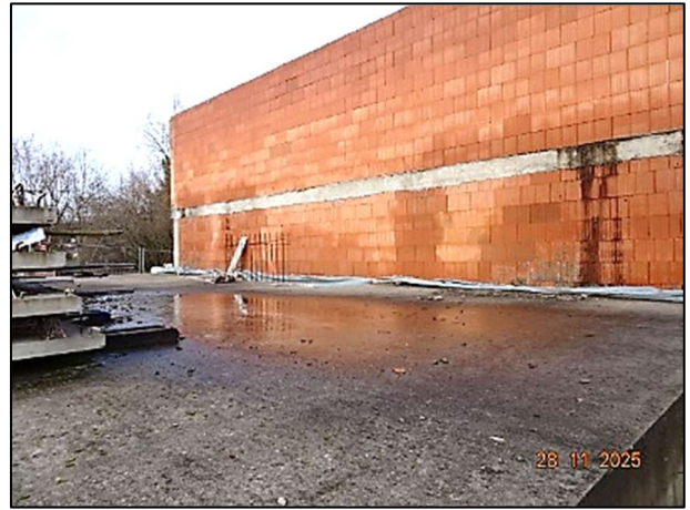
Rohbau Fl.Nr. 259/6 und Fl.Nr. 259/7