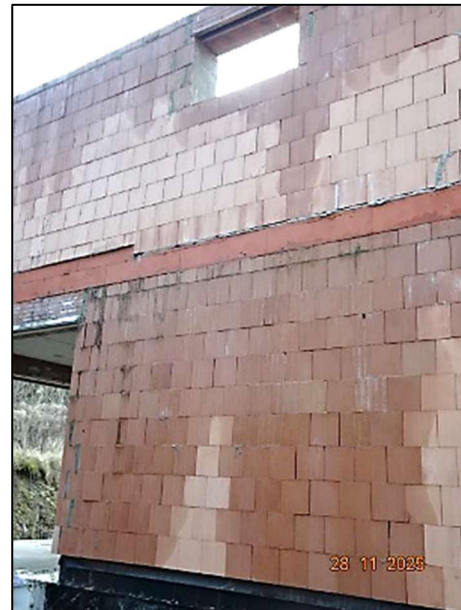
Rohbau Fl.Nr. 259/6 – durchnässte Außenwand