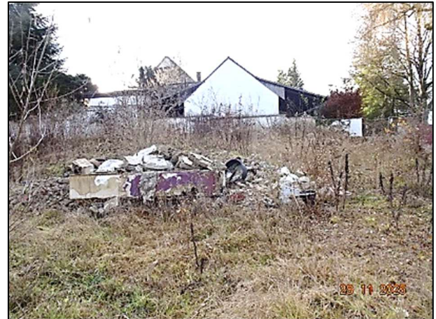
Blick nach Westen