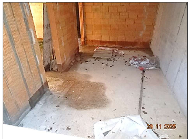
Rohbau Fl.Nr. 259/7 - KG