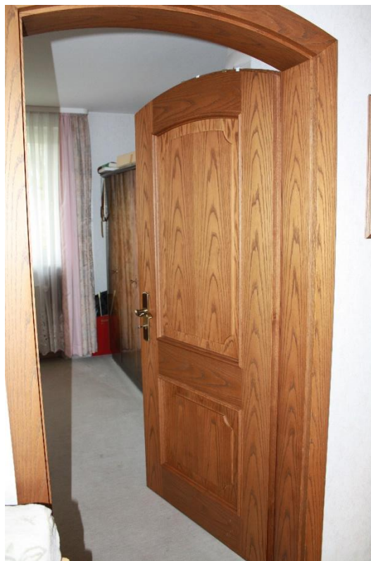
Im Obergeschoss sind diese furnierten Holztüren eingebaut.