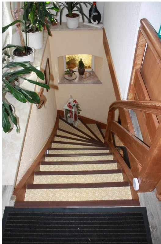
Treppe vom Erdgeschoss ins Obergeschoss