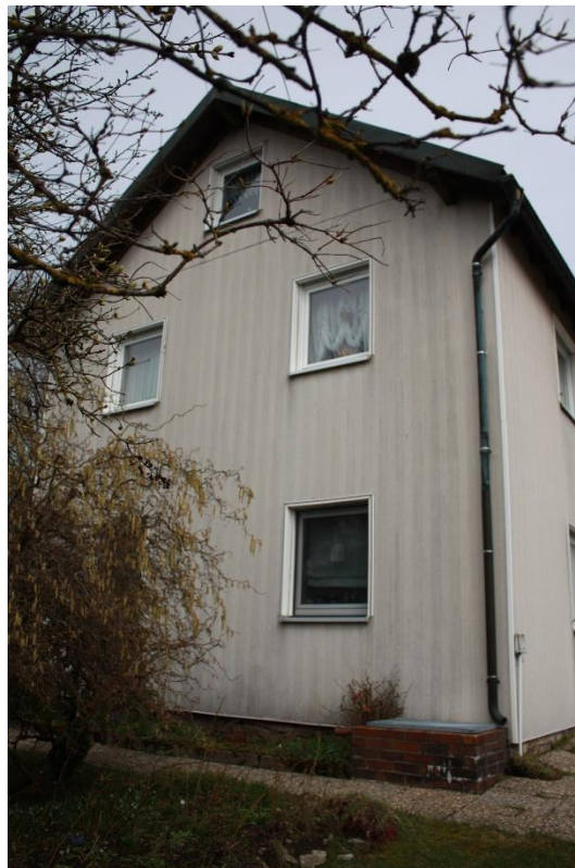
der Südgiebel des Hauses