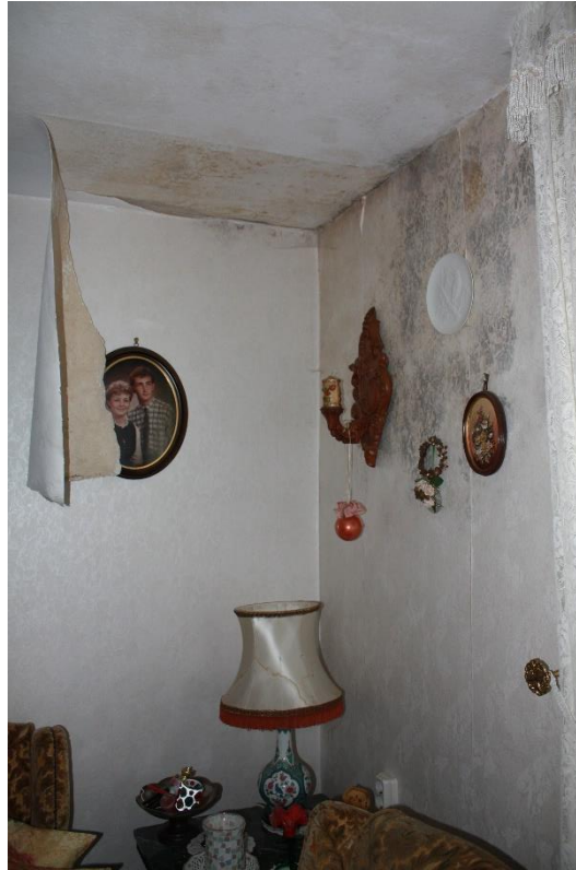
Feuchtigkeitsschäden an der Außenwand