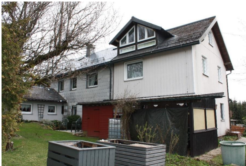
die westliche Längsseite (nördlich) des Gebäudes