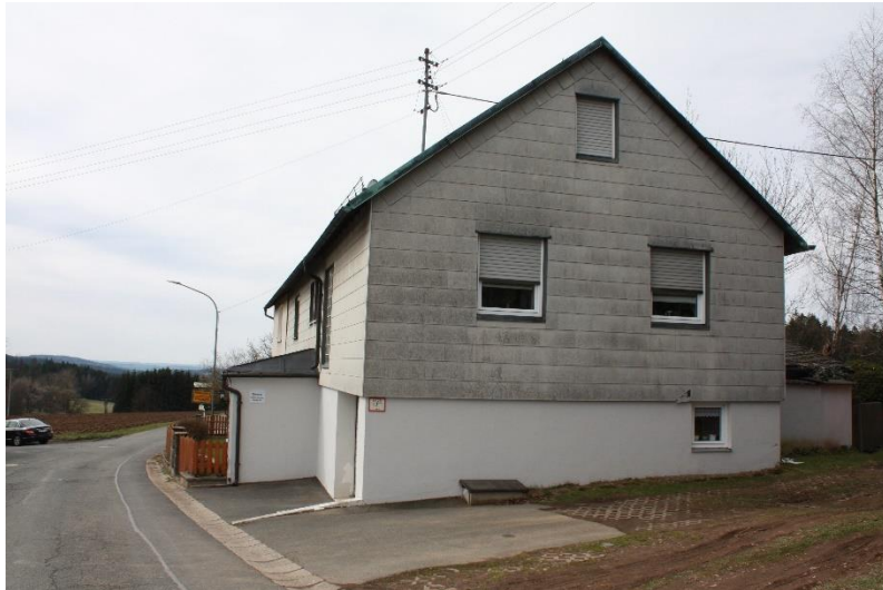
der Nordgiebel des Hauses, davor der KFZ-Abstellplatz (im Lageplan S)