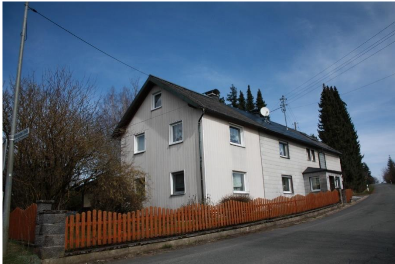
das Gebäude von der Walberngrüner Straße aus gesehen