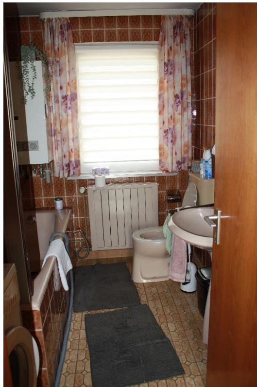
Sanitärraum im Obergeschoss