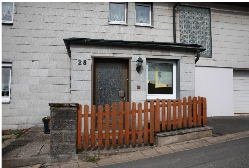
die Eingangssituation (s. Pfeil im Lageplan)