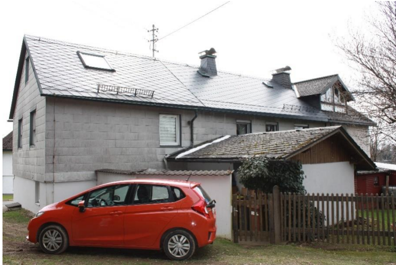
Blick auf die westliche Längsseite des Wohnhauses