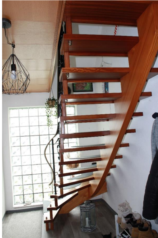
Intern-Treppe vom Obergeschoss in die Räume des Dachgeschosses