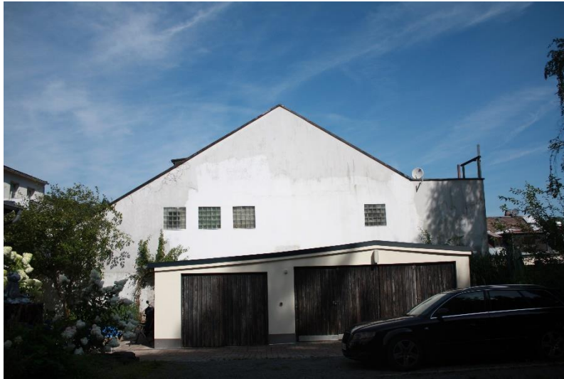
Die Giebelwand zu Flur-Nr. 733 ist als Brandwand gem. BayWo ausgebildet.