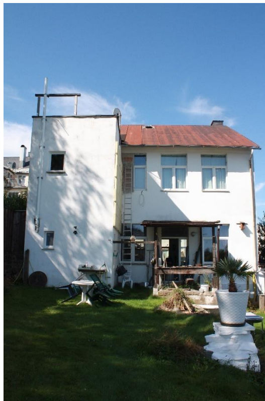
Die Ostseite des Gebäudes, links die WC-Anlage, die im Gutachten AZ: 1 K 85/23 bewertet wurde.