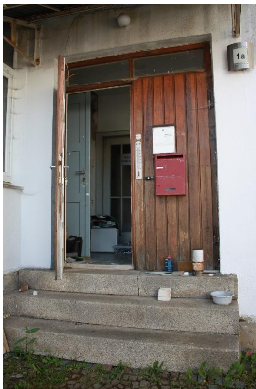
der Eingang zum Weberei-Gebäude (s. Pfeil im Lageplan)