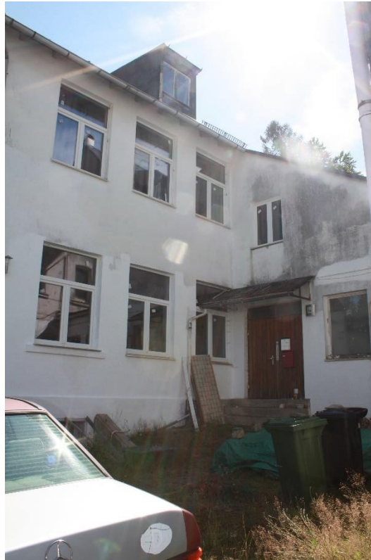
Blick auf das Gebäude von Norden