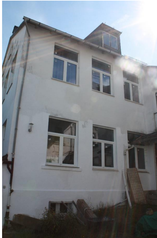
Längswand im Westbereich mit neuen Fenstern