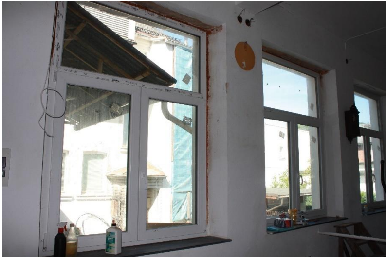
Im Gebäude sind neue Fenster eingebaut.