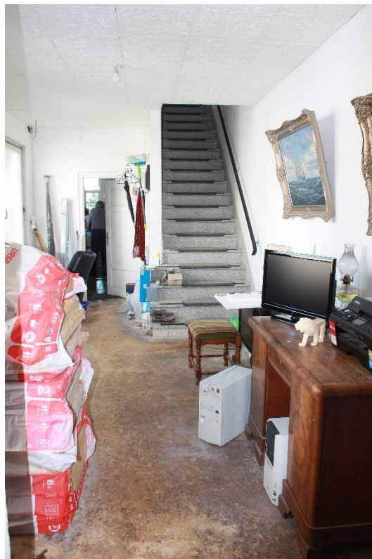
Treppe aus dem Zwischengeschoss ins Obergeschoss des Weberei-Gebäudes