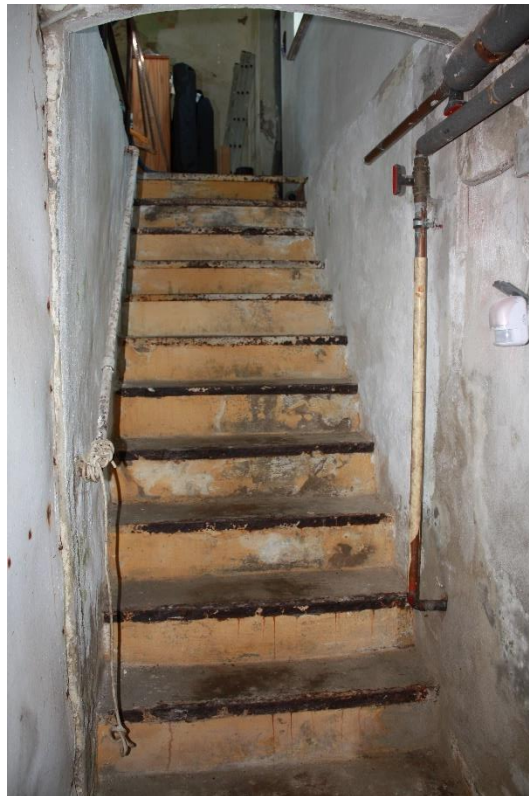
Treppe zur Teilunterkellerung