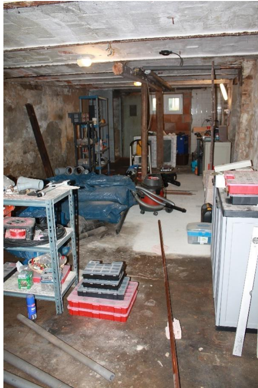
Blick in die Teilunterkellerung