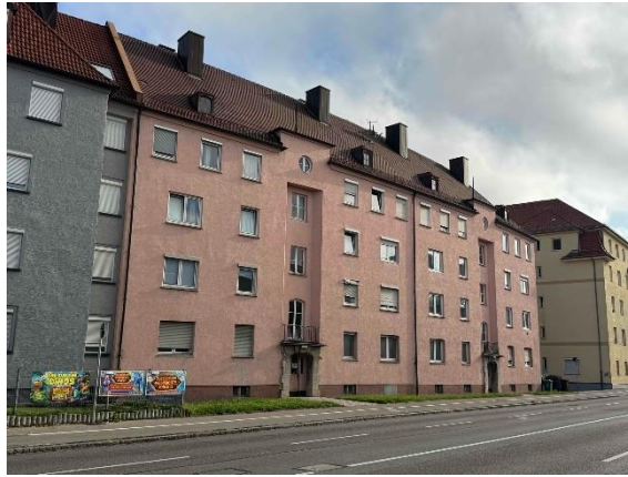
Bewertungsobjekt, Ansicht von Westen