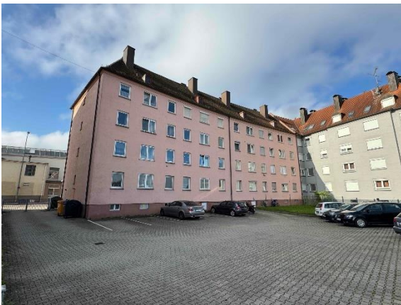
Bewertungsobjekt, Ansicht von Nordosten