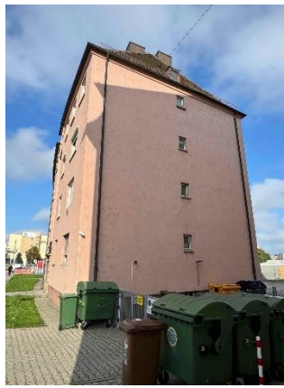
Bewertungsobjekt, Ansicht von Osten