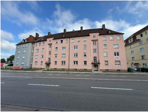
Bewertungsobjekt, Ansicht von Südwesten