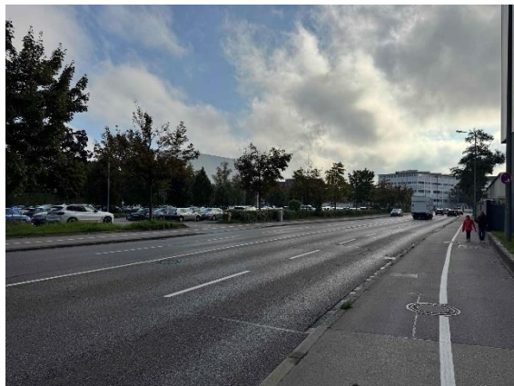
„Riedingerstraße“ Blickrichtung Osten