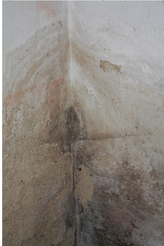
Schimmel an allen Ecken und Enden