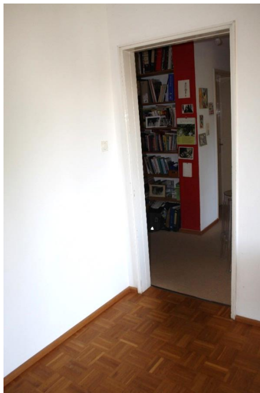
Im Gebäude ist Parkett-Kleinmosaik, aber auch Teppichboden verlegt. Die gestrichenen Holztüren stammen aus dem Baujahr.