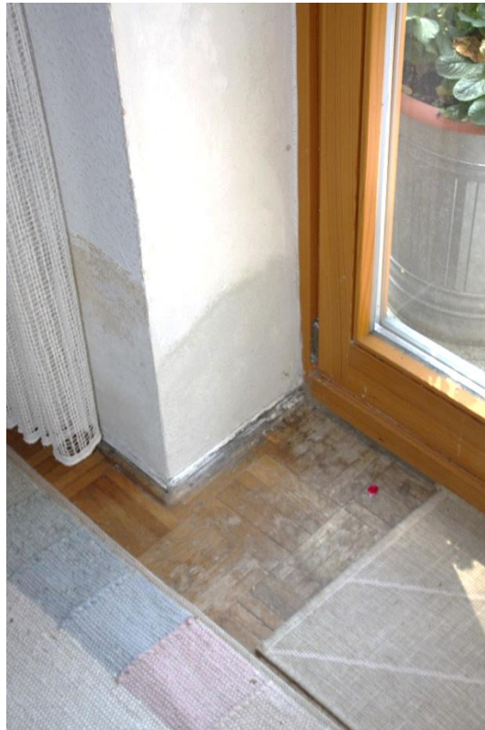
Feuchtigkeitsschaden am Parkett