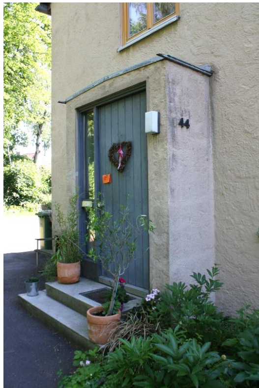
die Haustüre des Zweifamilienwohnhauses (siehe Pfeil im Lageplan)