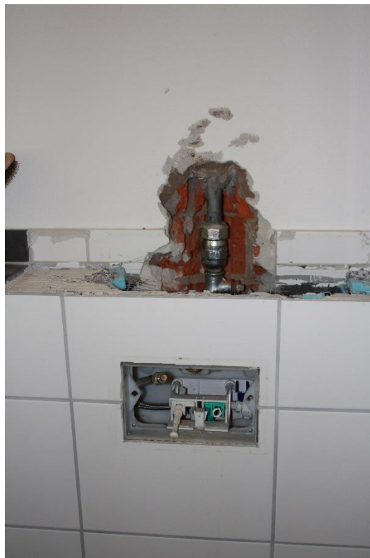
defekte Leitung in einem der Bäder/WC