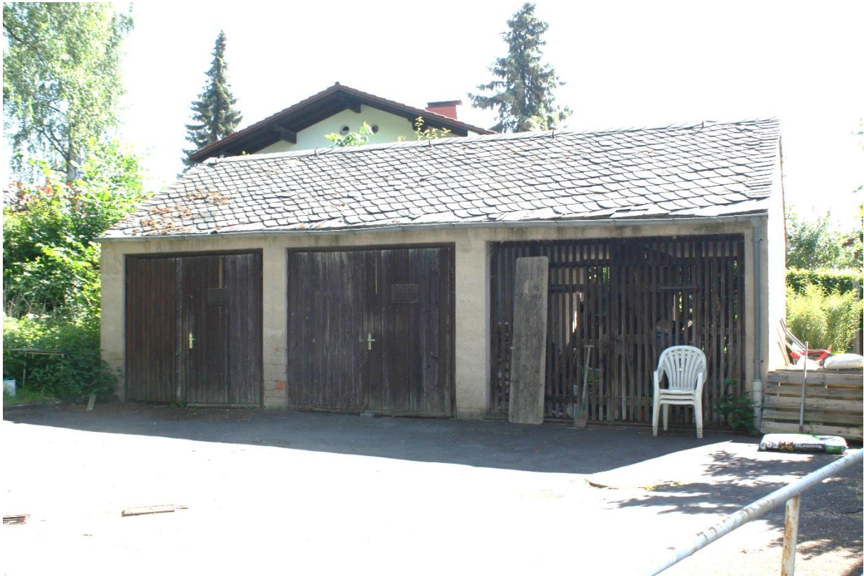
Das Nebengebäude ist abbruchreif.