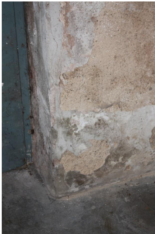
Alle Kellerwände innen sind durchfeuchtet.