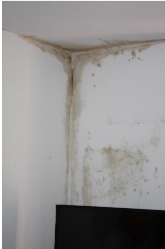
Schimmelbildung in den Ecken verschiedener Räume