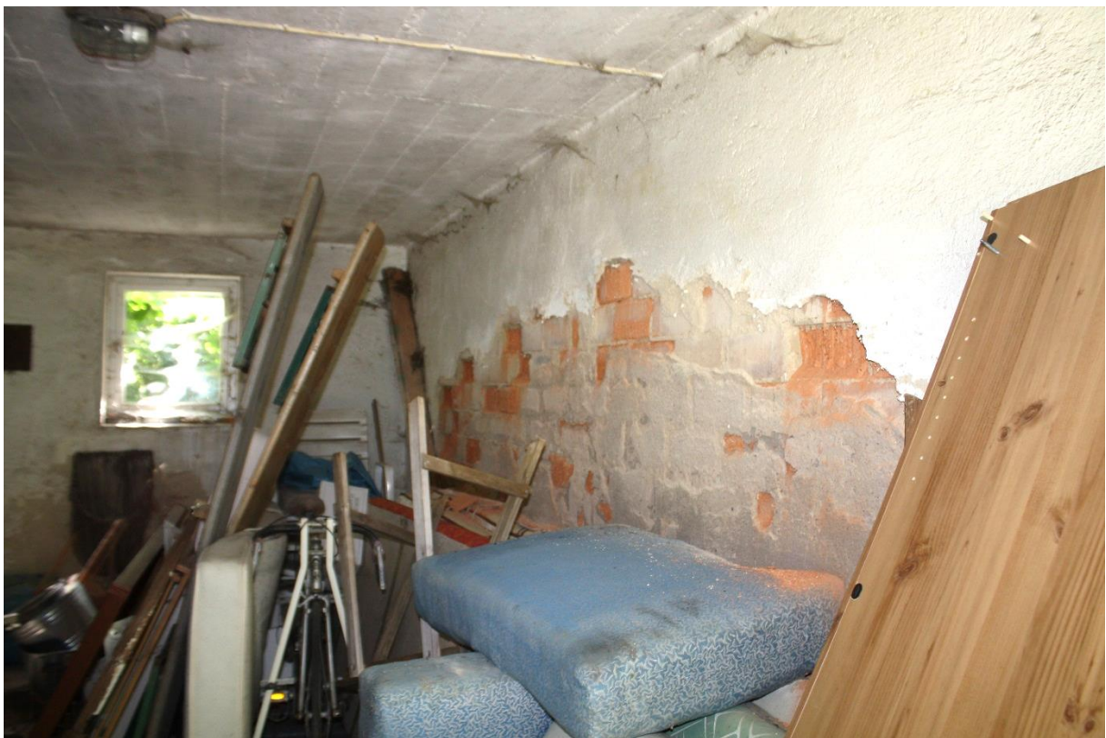
Innenansicht mit Putzschäden des Nebengebäudes