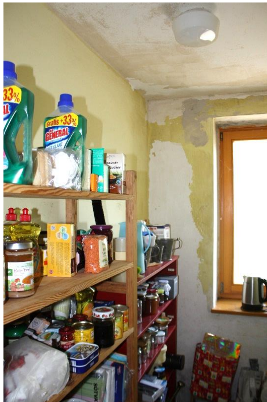
Baumängel im Fensterbereich des Nebenraumes