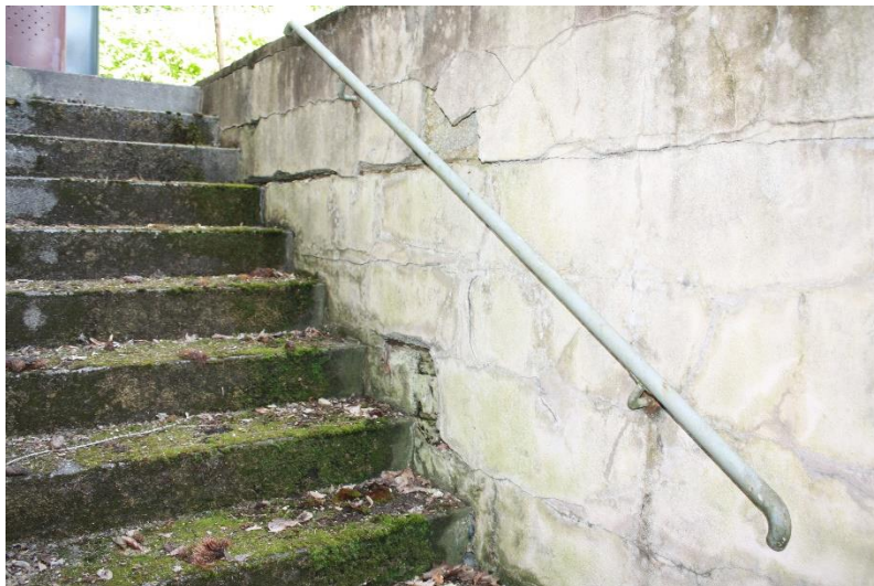
Die Außenmauern des Kellerabgangs sind stark gerissen.