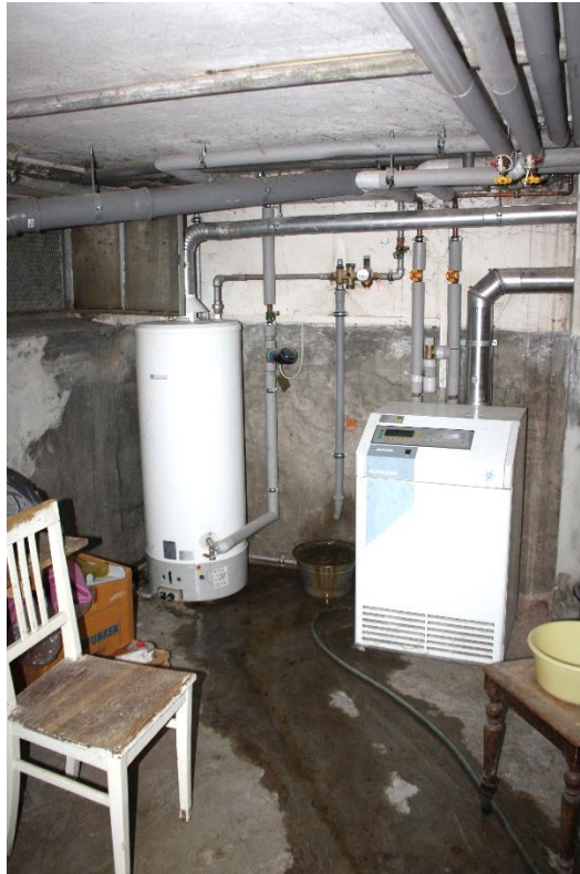
der Heizraum mit Gasheizkessel und Warmwasserboiler