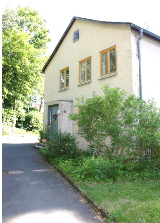
der Westgiebel des Zweifamilienwohnhauses