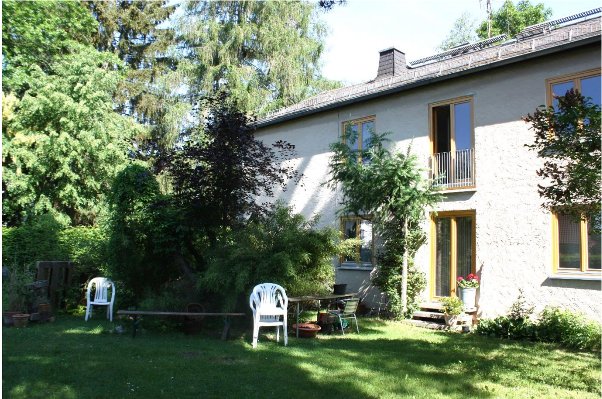
die Südseite des Zweifamilienwohnhauses