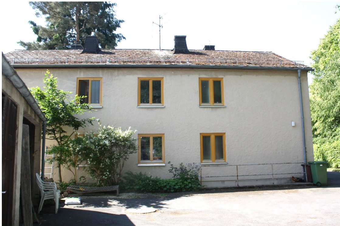
die Nordseite des Zweifamilienwohnhauses, links das Nebengebäude