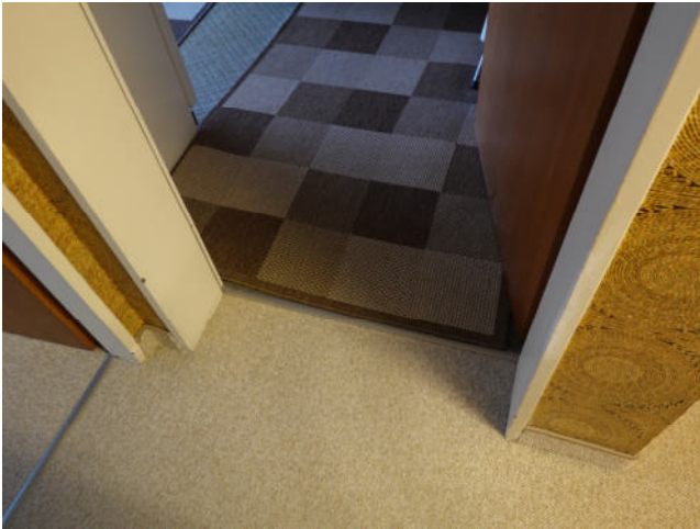
Ausstattungsstandard innenliegendes WC

Beispiel üblicher Ausstattungsstandard (Böden, Wände, Türen) und Bad ..... im Wohnungseigentum B 32