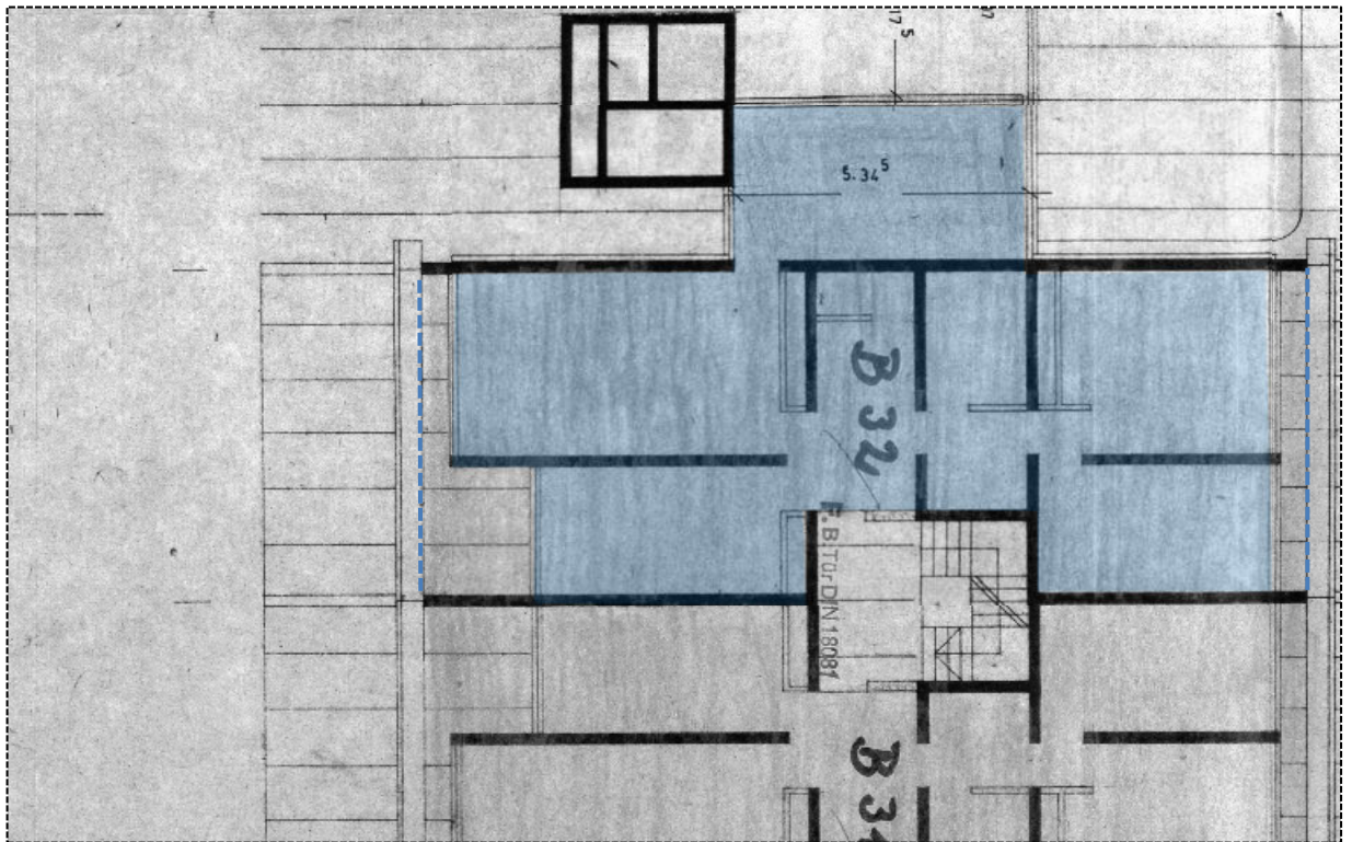
Grundriss 6. OG mit Darstellung 1 des Wohnungseigentums B 32, blau markiert