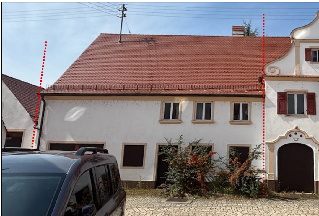
Foto 7 Ansicht von Norden