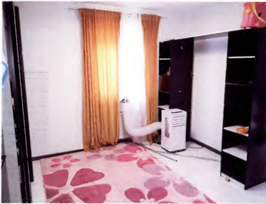
Abbildung (64) Bereich Ankleidezimmer.