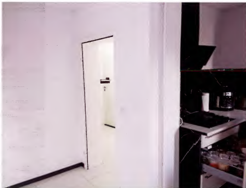
Abbildung (65) Blick vom großen Esszimmer durch die Tür hindurch zum Wohnungsflur. Rechts im Bild der vom Esszimmer aus offen begehbare Küchenbereich.