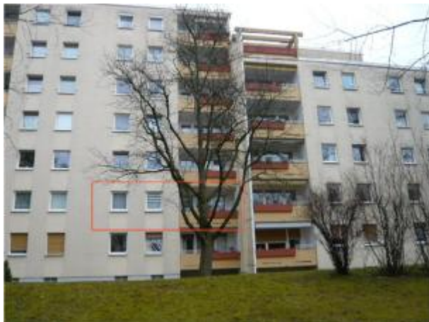
Ansicht v. Westen