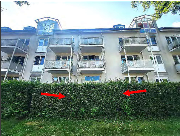
Nahansicht Westseite von Mitterfeldring 6; die ETW Nr. 23 befindet sich im EG