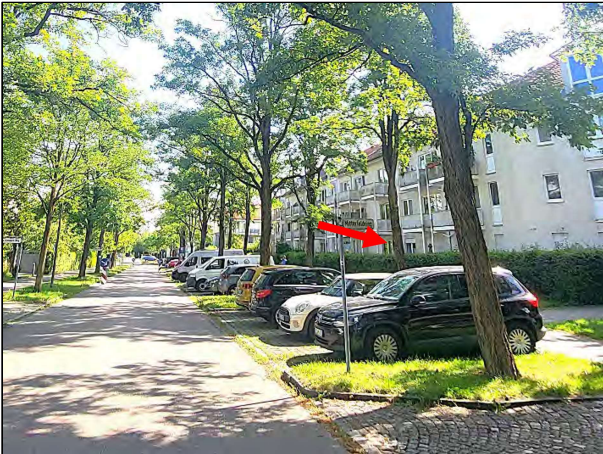
Blick in den Mitterfeldring in nordöstliche Richtung; Haus-Nr. 6 befindet sich an der Ostseite (s. Pfeil)