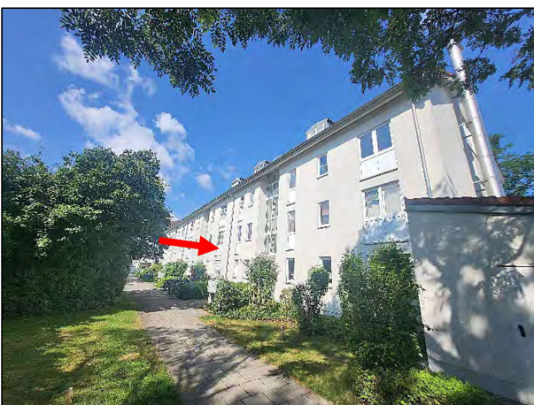
Blick in den Zugangsweg zu den Hauseingängen im Innenhof; Haus-Nr. 6 siehe Pfeil