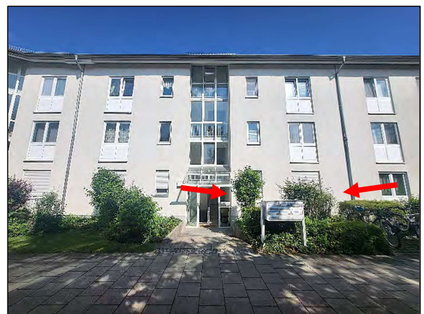
Vorderansicht (Ostseite) Mitterfeldring 6 Lage ETW Nr. 23 im EG