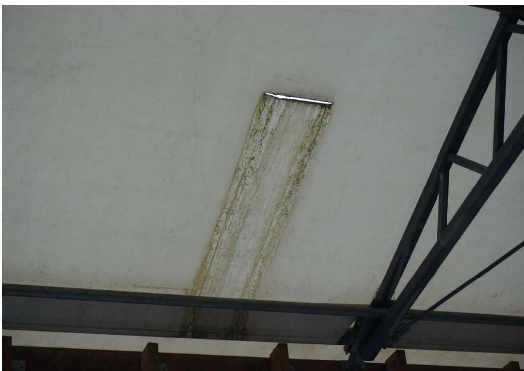
Bild 33: Ein Riss in der Dachplane im Kälber- und Jungviehbereich