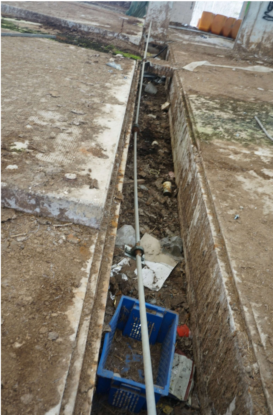
Bild 27: Ein weiterer, vermüllter Gülleabwurfschacht vor dem Melkstandbereich. Diese Schächte sollte bei Nutzung als Lagerhalle mit Metaldeckeln versehen werden.