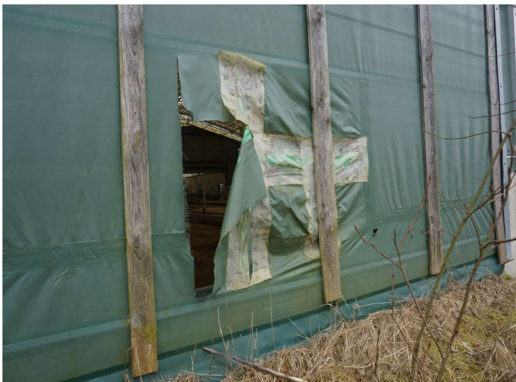
Bild 32: Eine größere Beschädigung an einem Rolltor in der nördlichen Giebelwand