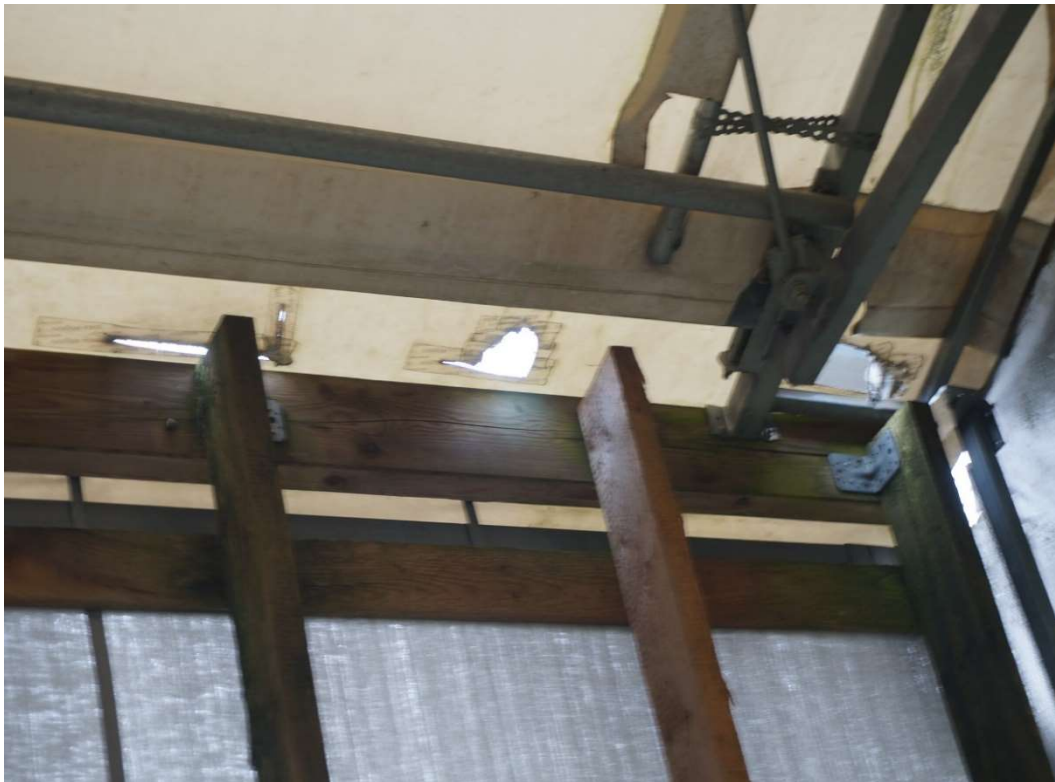
Bild 34: Riss und Löcher in der Dachplane im Kälber- und Jungviehbereich