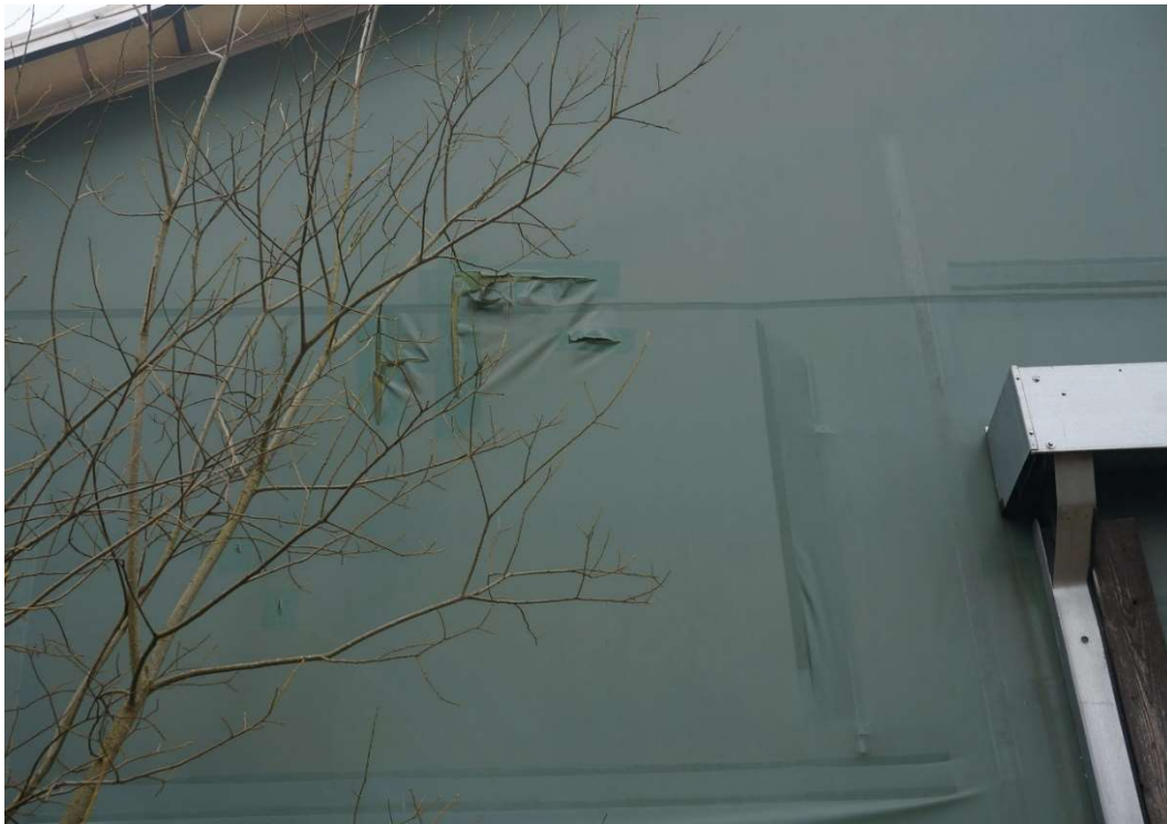
Bild 29: Deutliche Risse in der Giebelwandplane. Hier wurden bereits unsachgemäÙe Reparaturversuche durchgeföhrt.