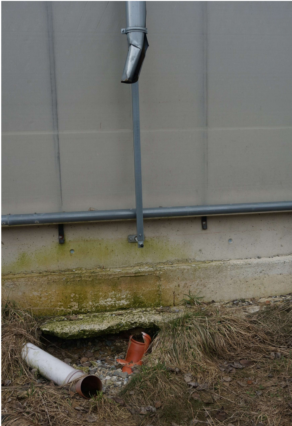
Bild 31: Fast alle Fallrohre des Stallgebäudes sind defekt. Zumindest wurde das Übergangsstück zwischen Regenwasserablaufleitung und dem Fallrohr entfernt.