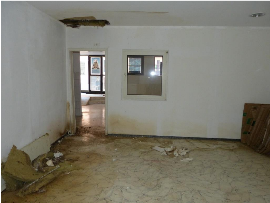
Teileigentum Nr. 002, Innenaufnahme Lager/Büro