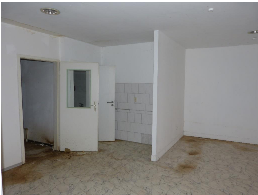
Teileigentum Nr. 002, Innenaufnahme Ladenfläche/Kochecke