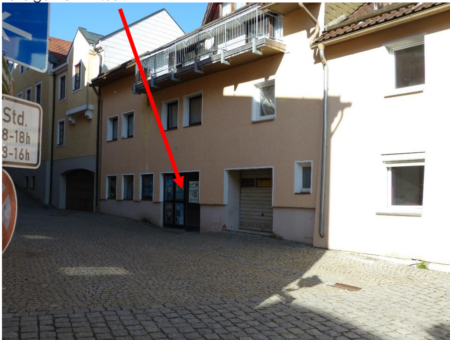
Gebäudeteil Baronreihe 1, Ansicht von Südosten