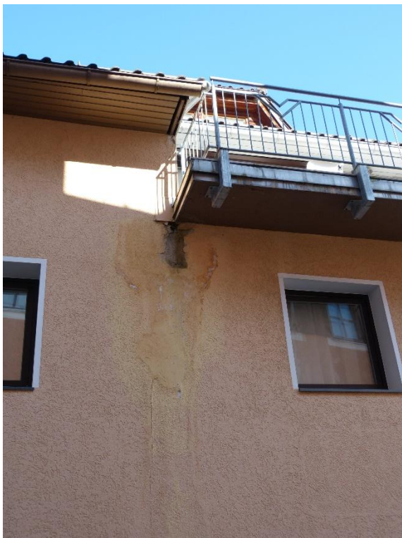
Teilansicht Südfassade mit Putzschaden