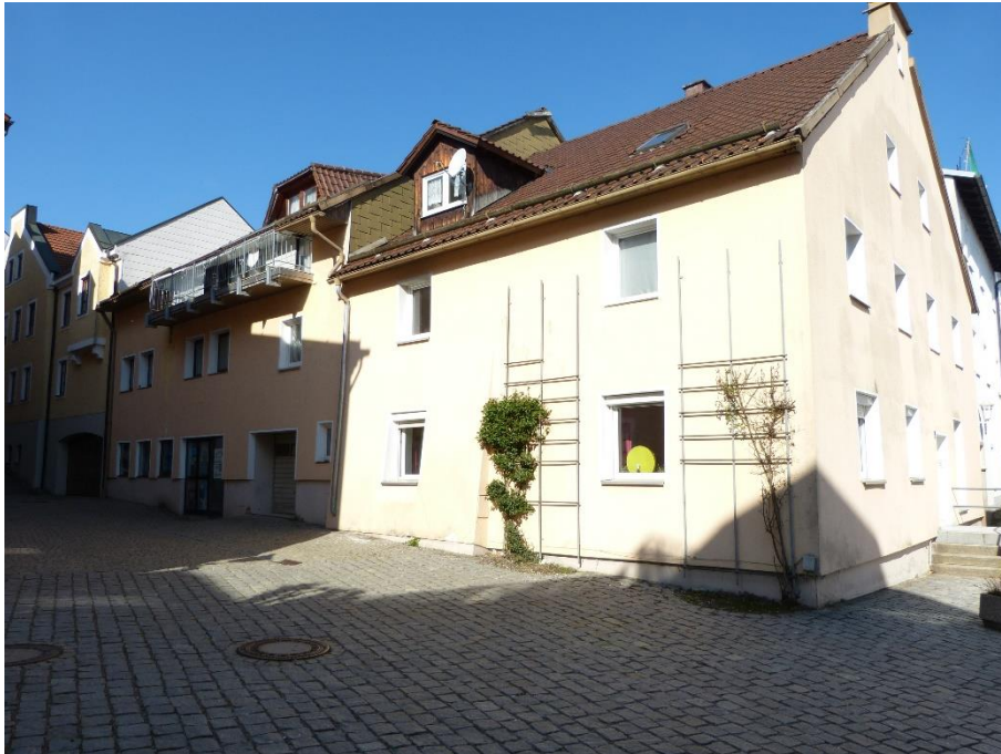
Gesamtgebäude, Ansicht von Südosten