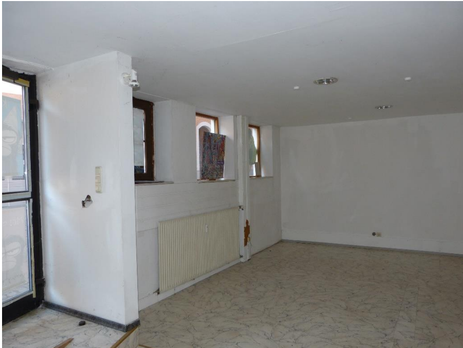
Teileigentum Nr. 002, Innenaufnahme Ladenfläche