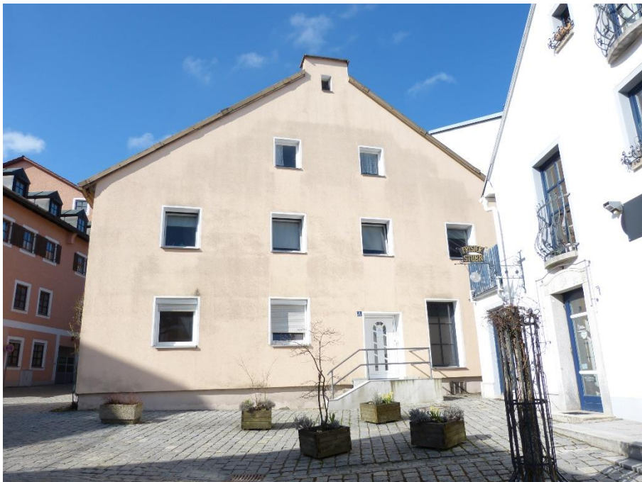
Gesamtgebäude, Ansicht von Osten