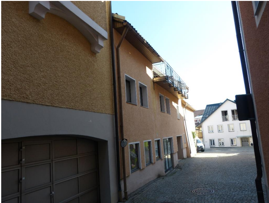
Gesamtgebäude, Ansicht von Westen