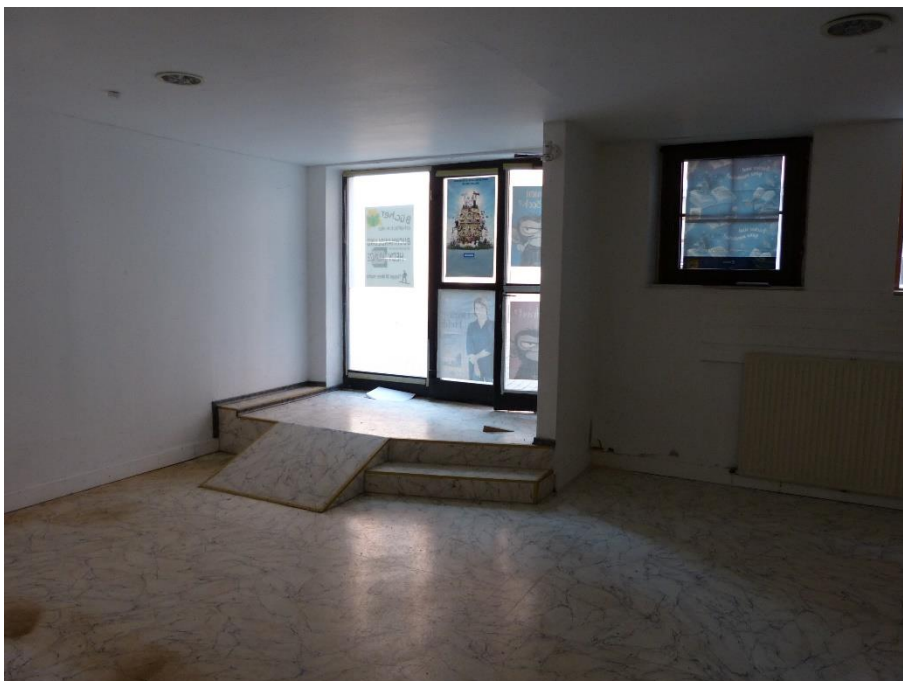
Teileigentum Nr. 002, Innenaufnahme Ladenfläche