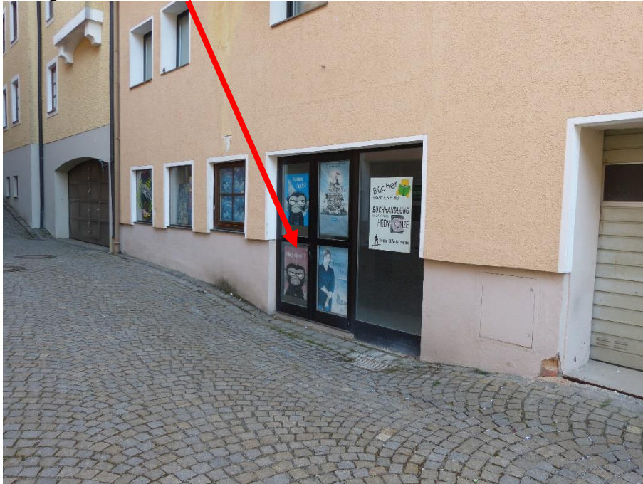
Gebäudeteil Baronreihe 1, Teilansicht Erdgeschoss