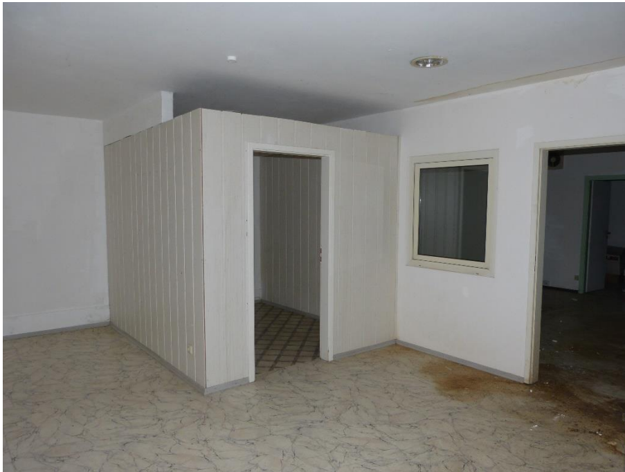
Teileigentum Nr. 002, Innenaufnahme Ladenfläche