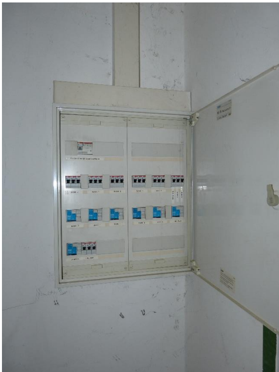
Teileigentum Nr. 002, Innenaufnahme Unterverteilung Strom