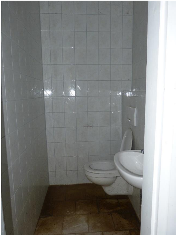
Teileigentum Nr. 002, Innenaufnahme WC