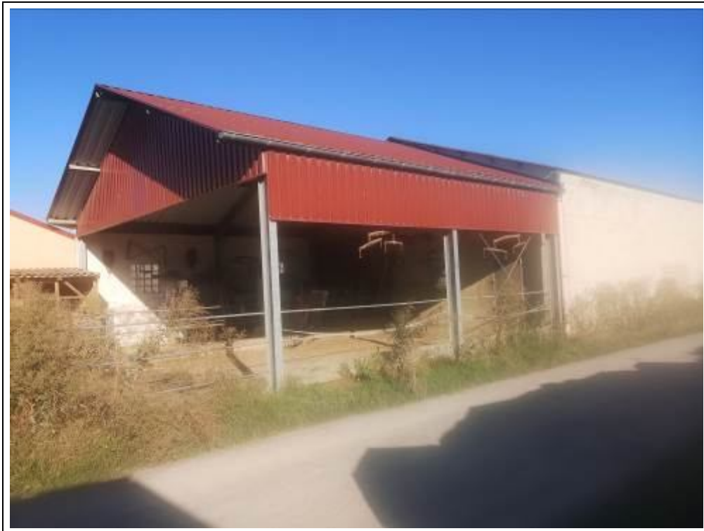
Bewertungsobjekt von Südosten