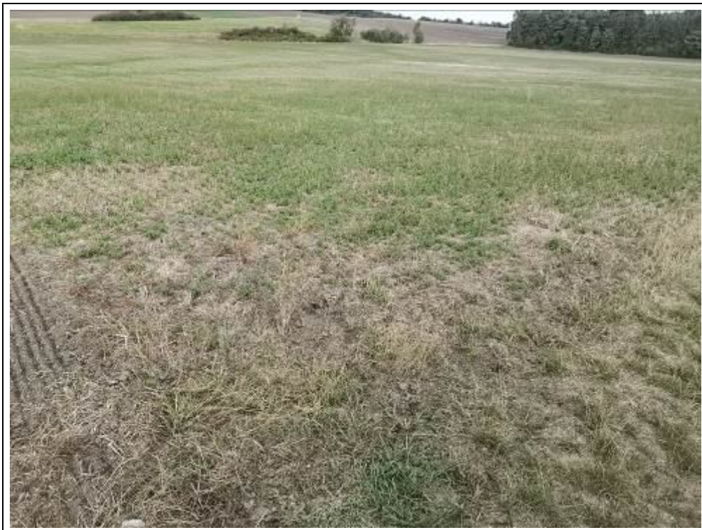
Blick auf das Bewertungsgrundstück, Flurstück 1388 (Nutzung als Ackerland)