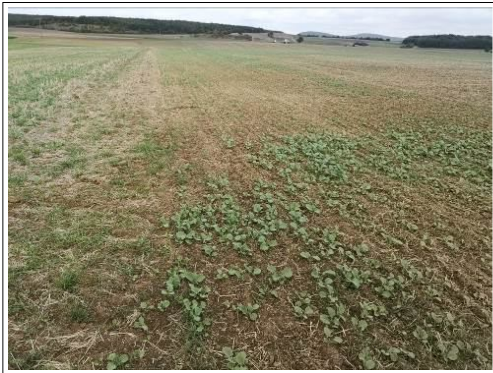
Blick auf das Bewertungsgrundstück, Flurstück 1488 und 1489 (Nutzung als Ackerland)