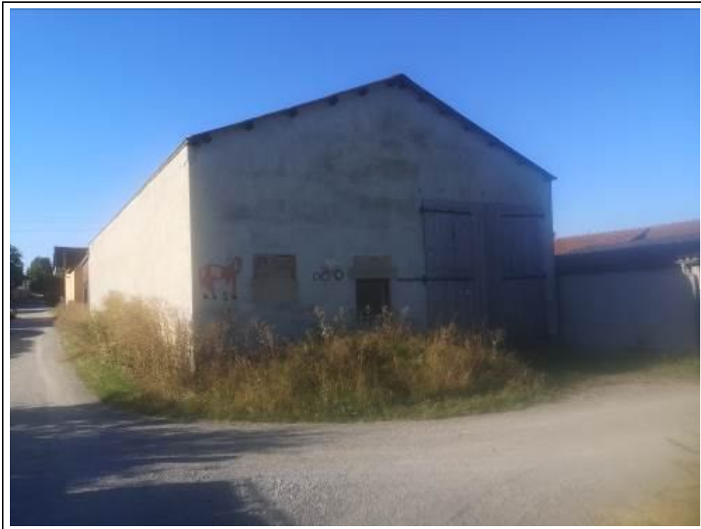
Bewertungsobjekt von Norden