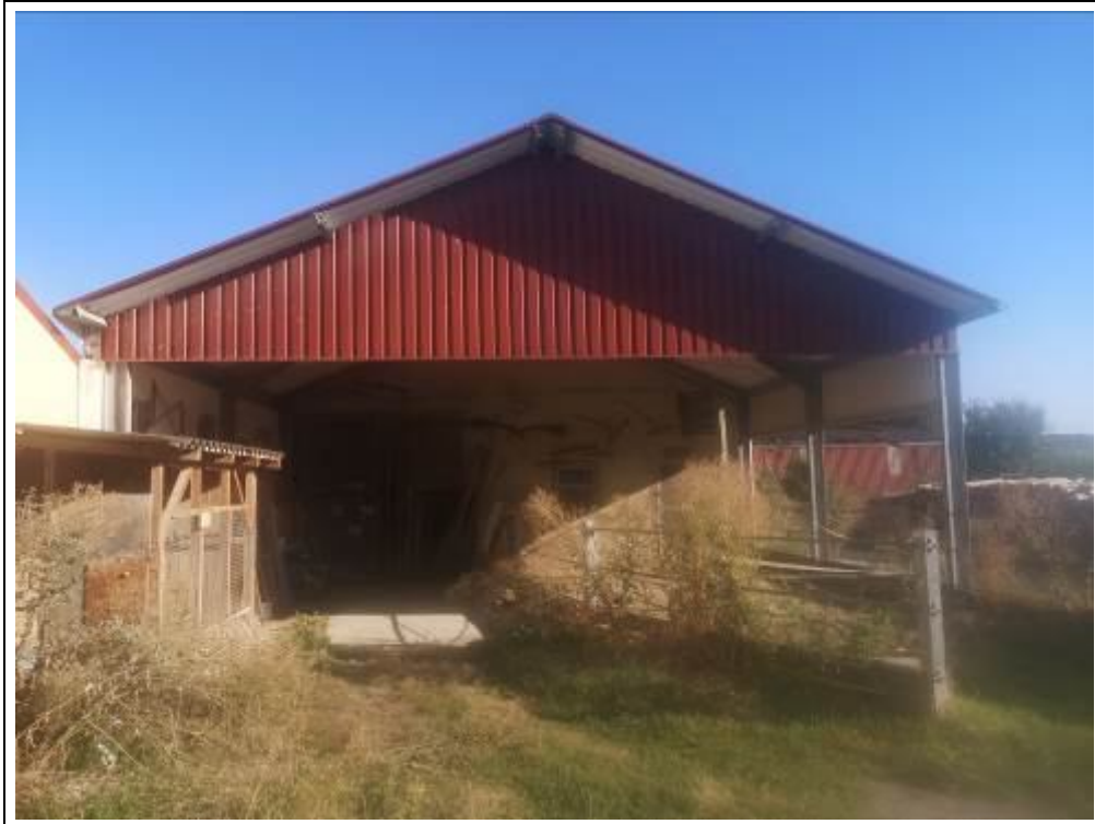
Bewertungsobjekt von Süden