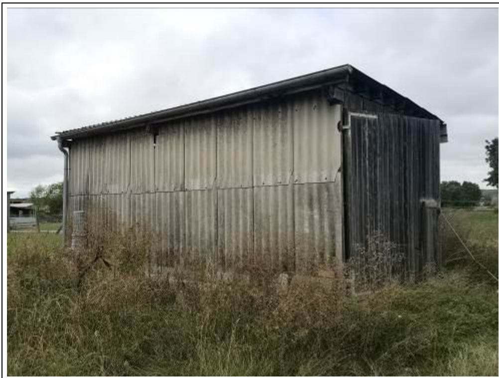
Blick auf die Unterstellhalle von Südosten