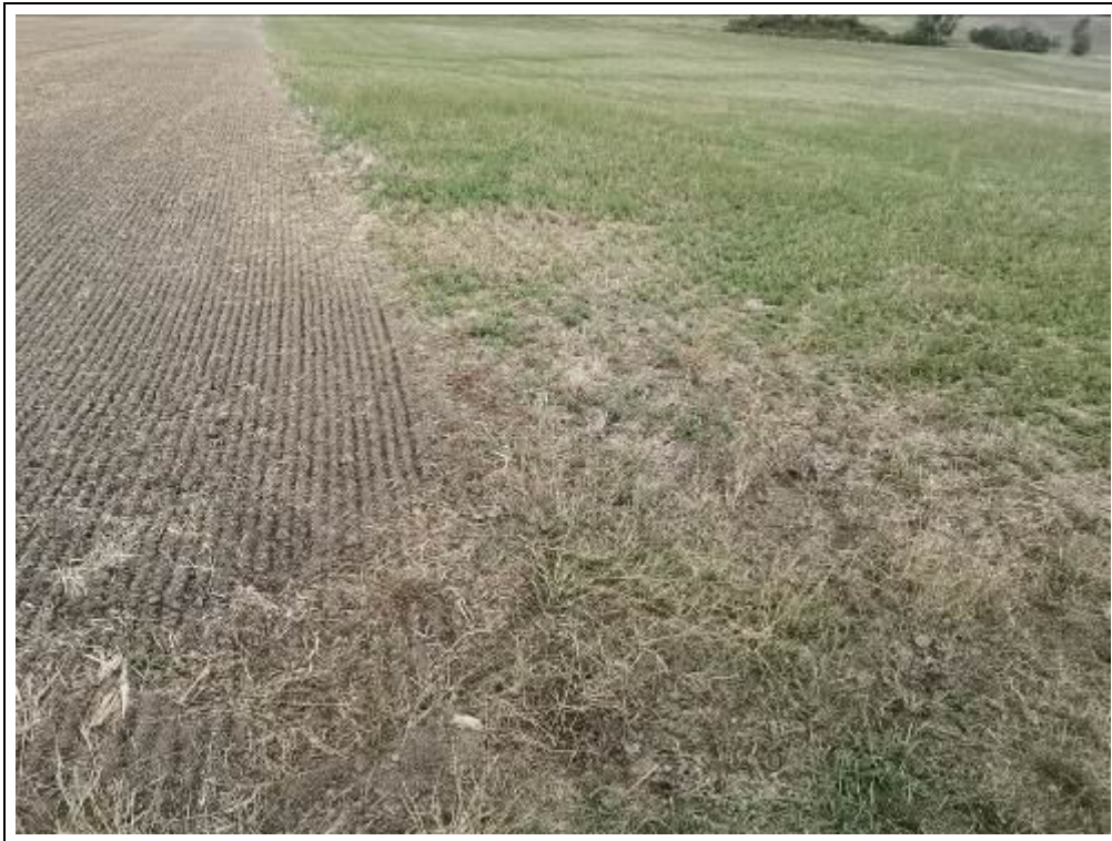
Blick auf das Bewertungsgrundstück, Flurstück 1388 (Nutzung als Ackerland)