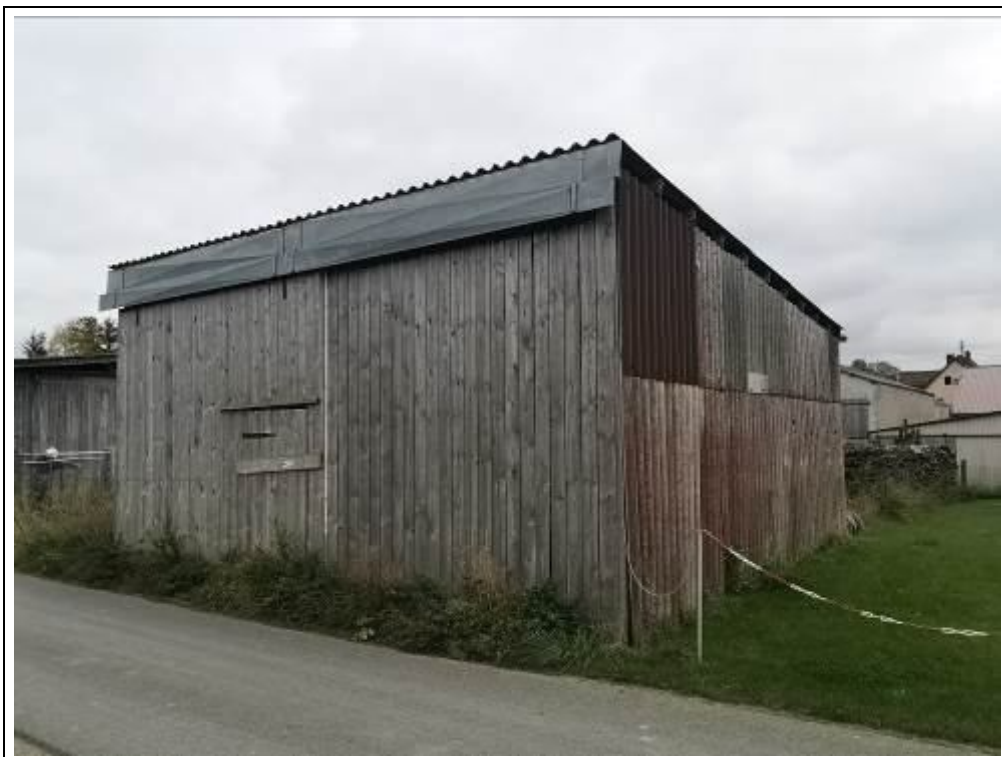
Blick auf die Unterstellhalle von Nordwesten