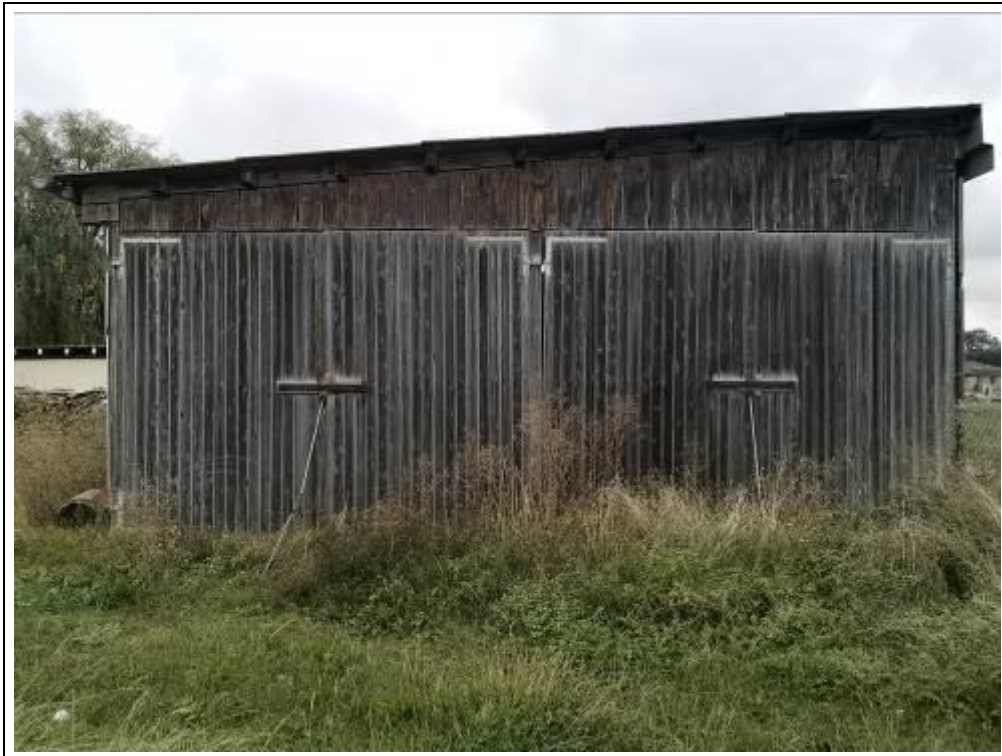
Blick auf die Unterstellhalle von Osten