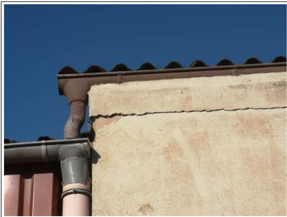
Blick auf Schäden im Mauerwerk und am Außenputz