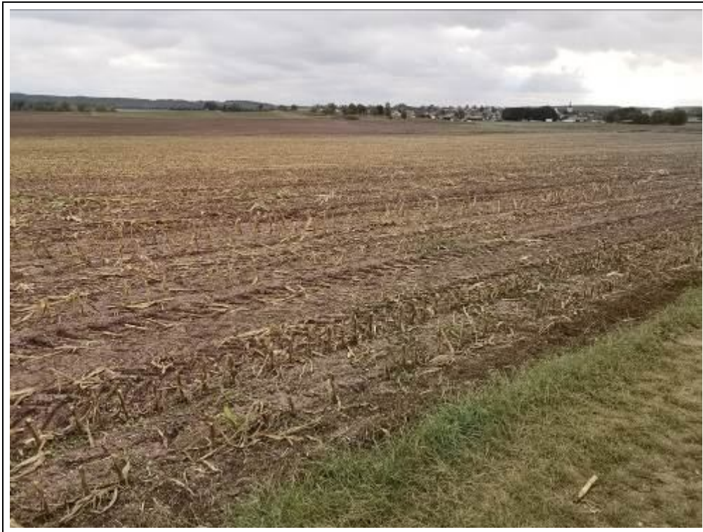
Blick auf das Bewertungsgrundstück, Flurstück 1153 und 1154 (Nutzung als Ackerland)