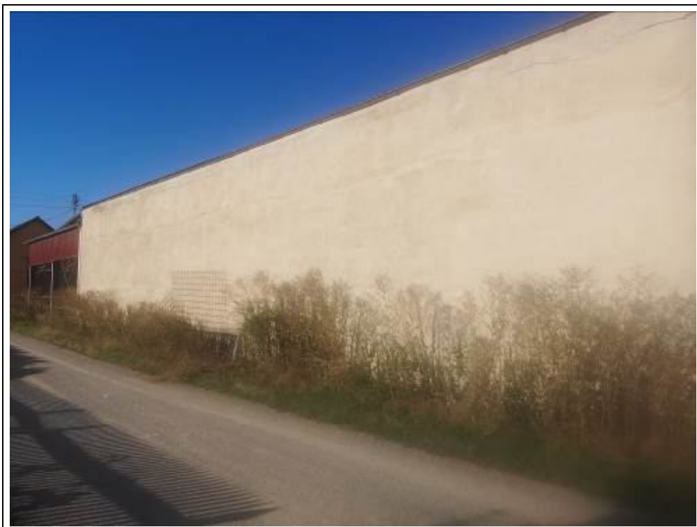
Bewertungsobjekt von Nordosten (Teilbereich)