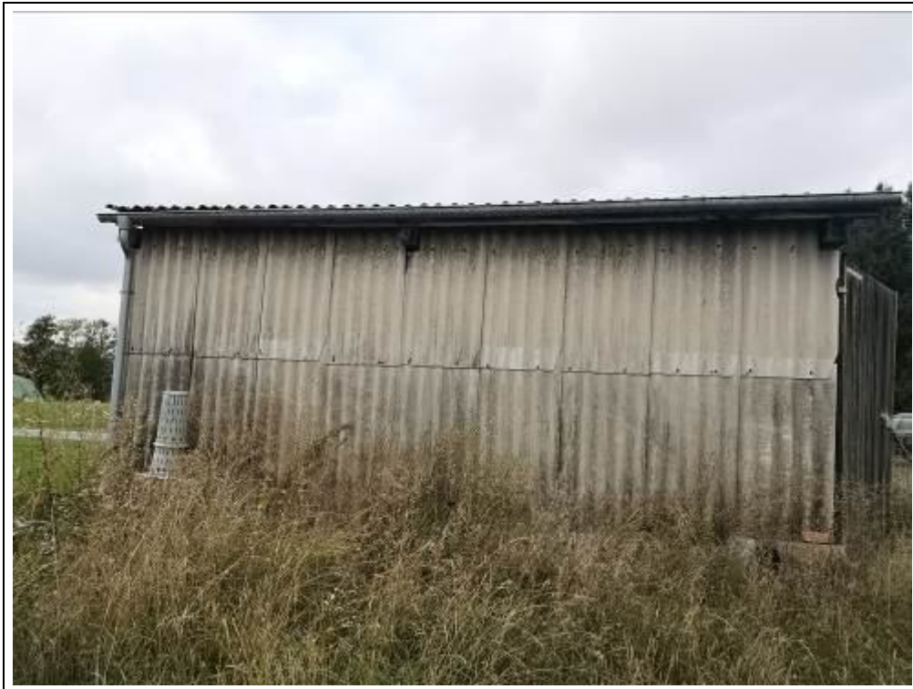
Blick auf die Unterstellhalle von Süden