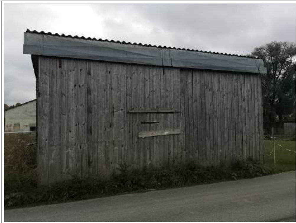
Blick auf die Unterstellhalle von Norden