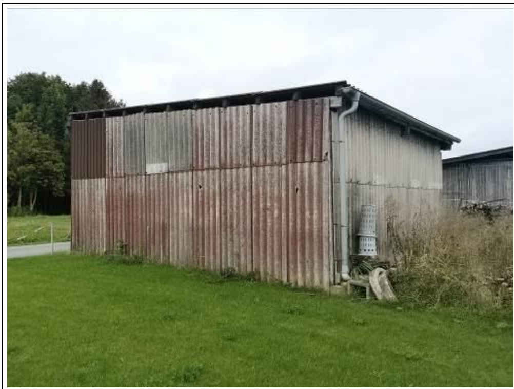
Blick auf die Unterstellhalle von Südwesten