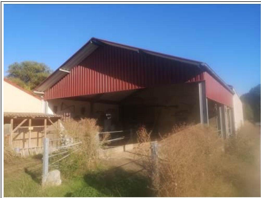
Bewertungsobjekt von Süden