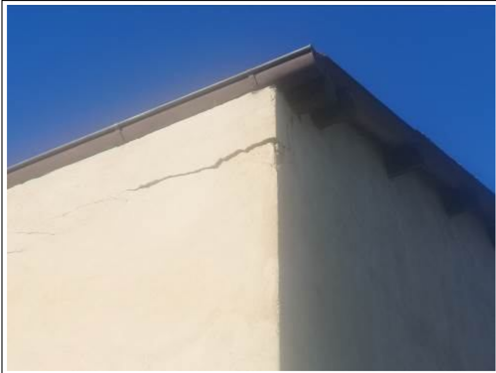
Blick auf Schäden im Mauerwerk und am Außenputz