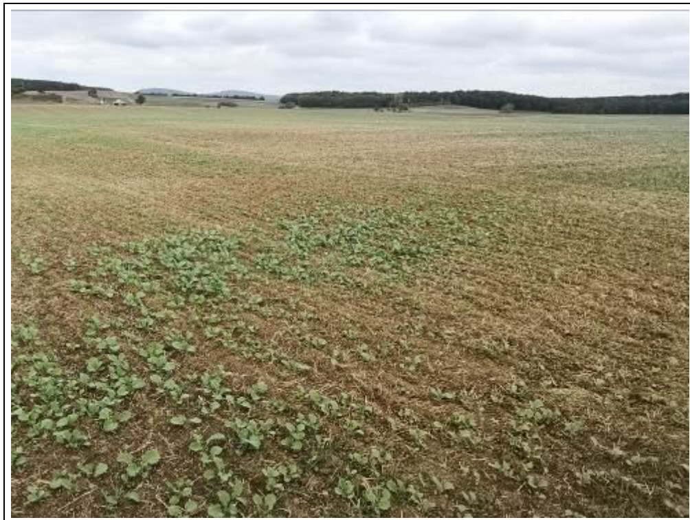
Blick auf das Bewertungsgrundstück, Flurstück 1488 und 1489 (Nutzung als Ackerland)