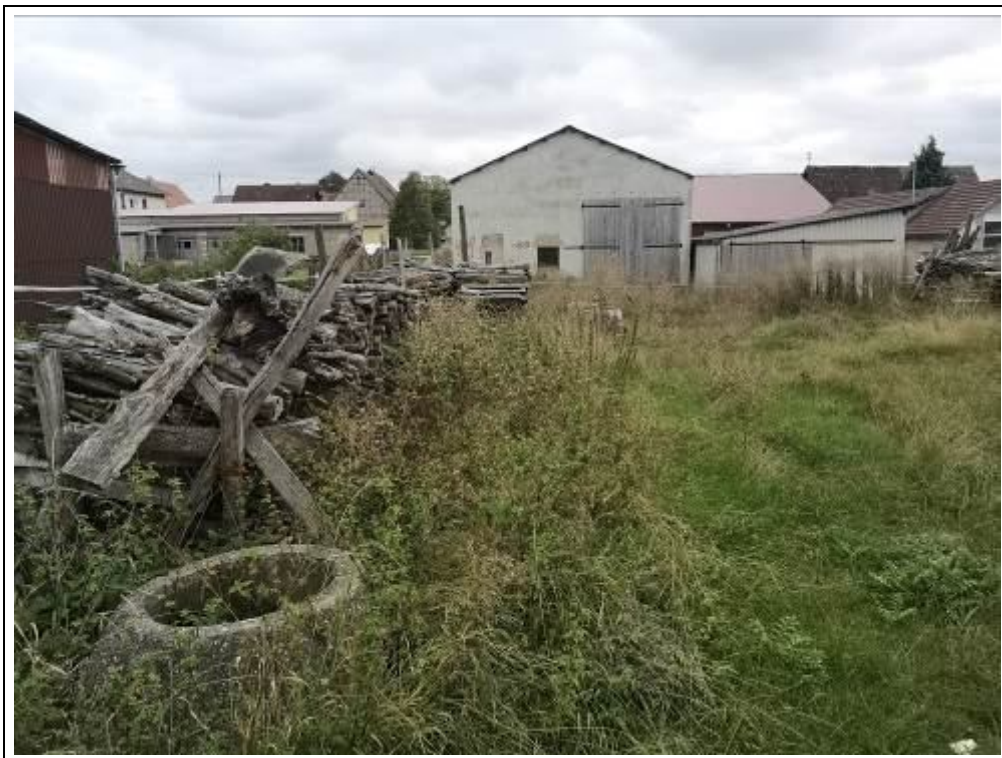
Blick in das Bewertungsgrundstück