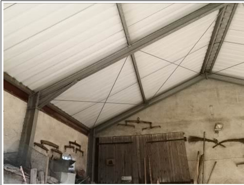
Blick in den offenen Anbau