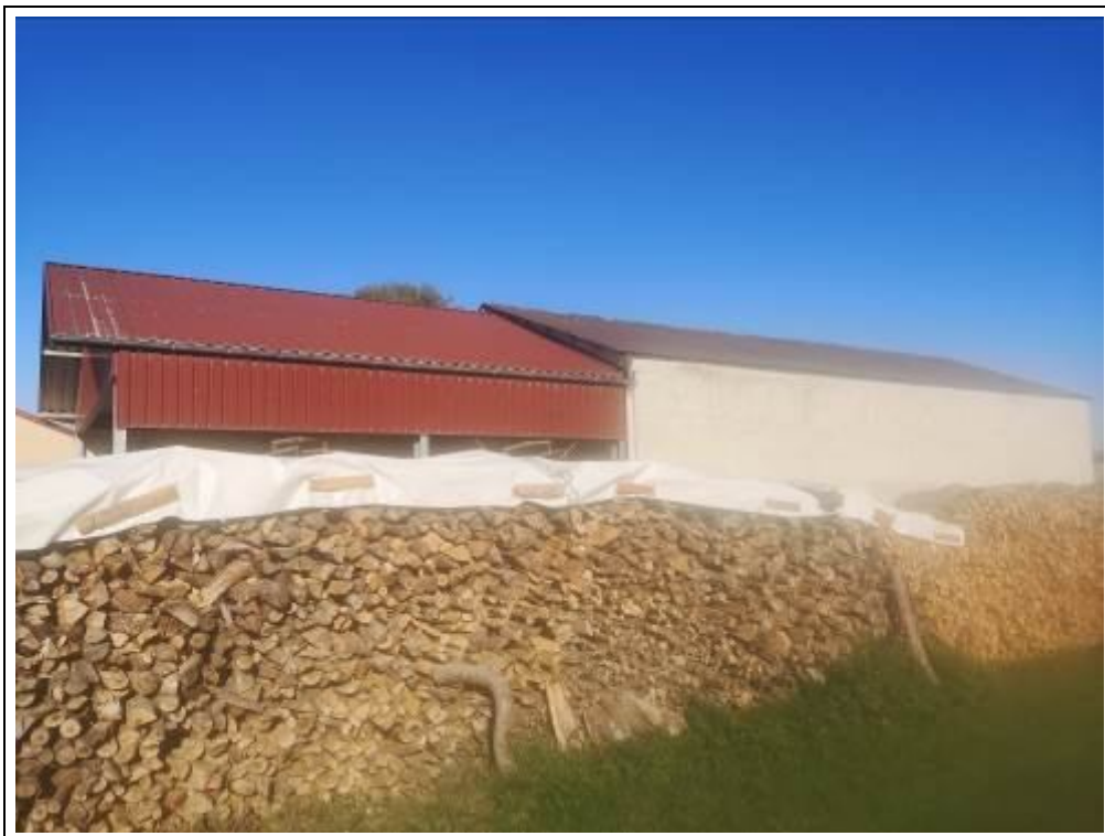
Bewertungsobjekt von Südosten