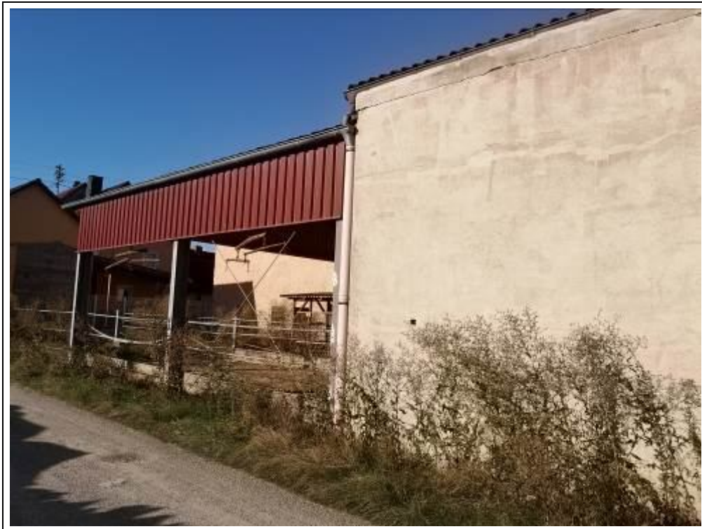
Bewertungsobjekt von Nordosten (Teilbereich)