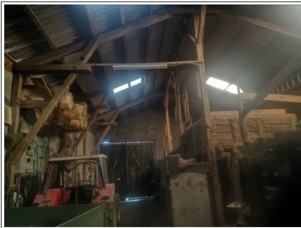
Blick in die Scheune