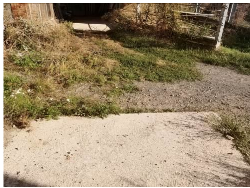
Blick in den Hofbereich