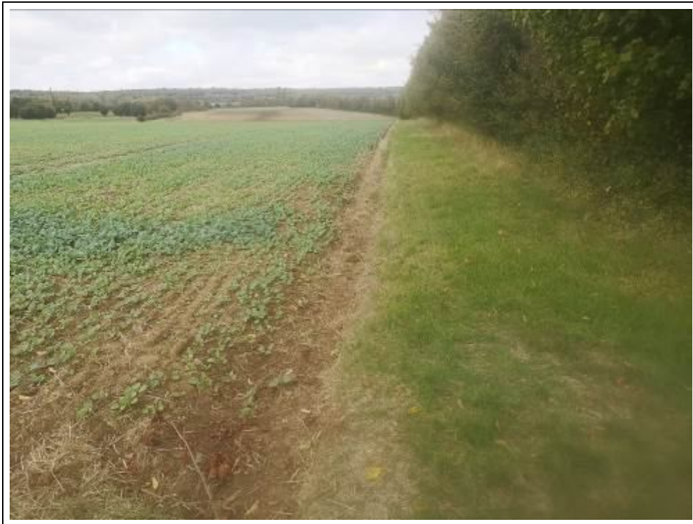
Blick auf das Bewertungsgrundstück, Flurstück 919 (Nutzung als Ackerland)