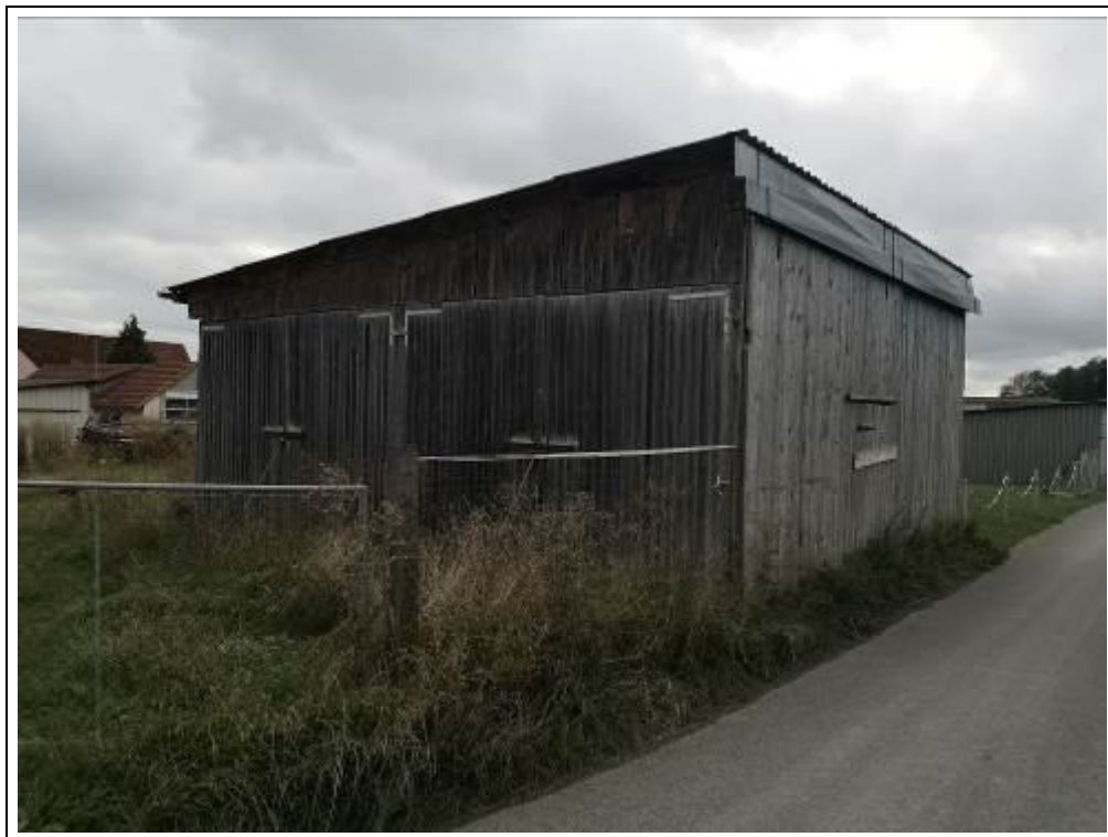
Blick auf die Unterstellhalle von Nordosten