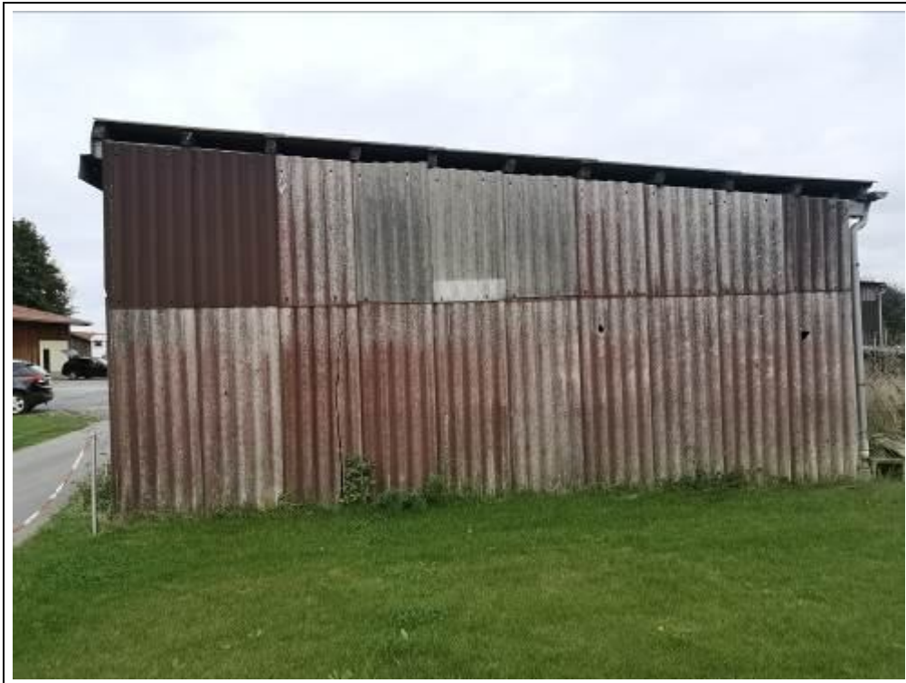
Blick auf die Unterstellhalle von Westen