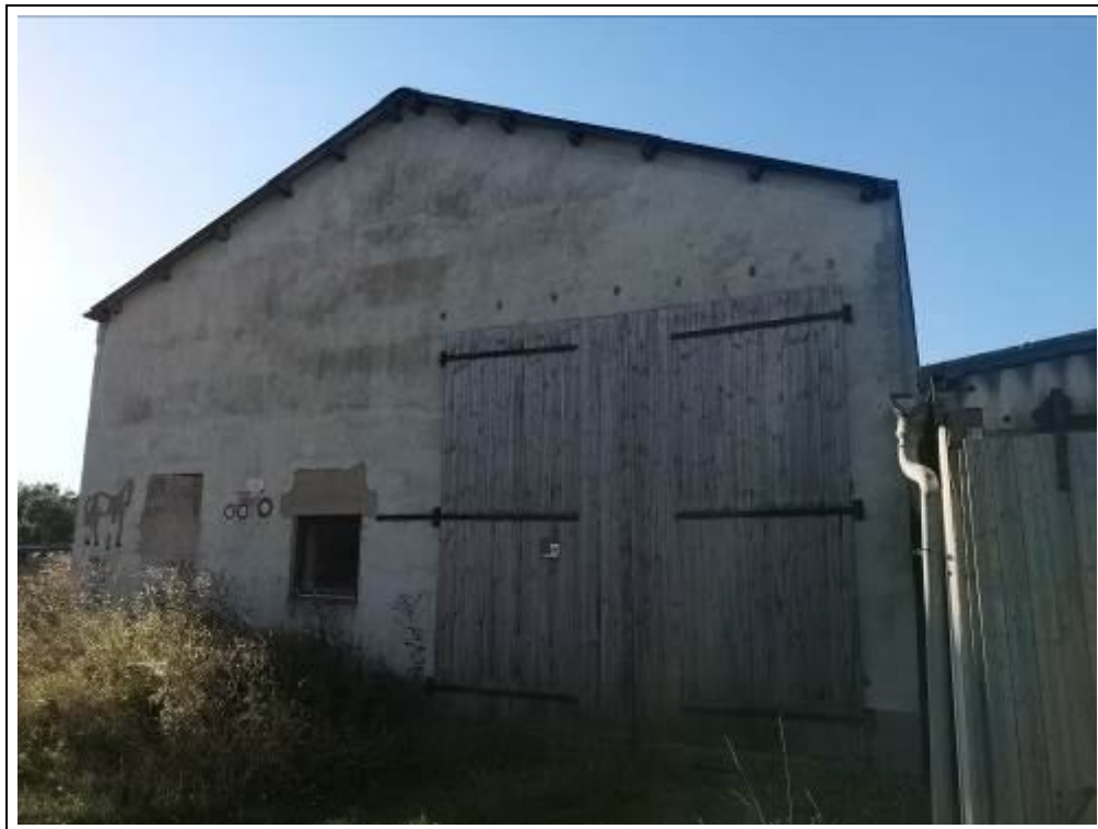
Bewertungsobjekt von Norden