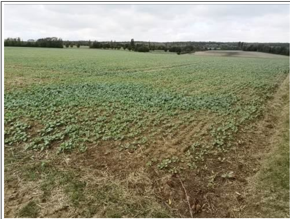
Blick auf das Bewertungsgrundstück, Flurstück 919 (Nutzung als Ackerland)