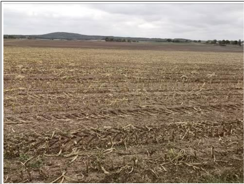
Blick auf das Bewertungsgrundstück, Flurstück 1153 und 1154 (Nutzung als Ackerland)