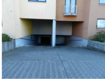
TG-Ein-/Ausfahrt auf Fl.-Nr. 493/11 und 493/12