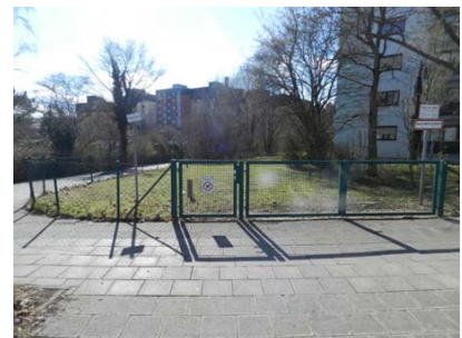
Zugang zu Fl.-Nr. 493/19 im Osten