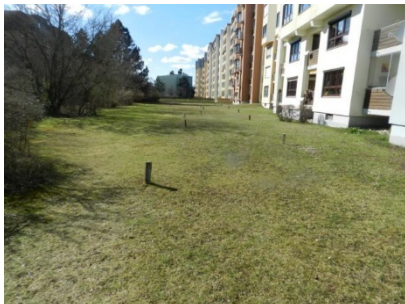
Fl.-Nr. 493/19; Blick von Ost nach West