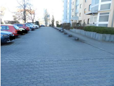
Zufahrt über Fl.-Nr. 493/12, 493/13

Von der Industrie- und Handelskammer öffentlich bestellter und vereidigter Sachverständiger für die Bewertung von bebauten und unbebauten Grundstücken einschl. Mieten und Pachten. Zuständig: IHK Nürnberg.