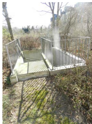
Treppe zur TG auf Fl.-Nr. 493/19