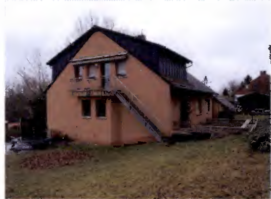
Ansicht von Südwesten