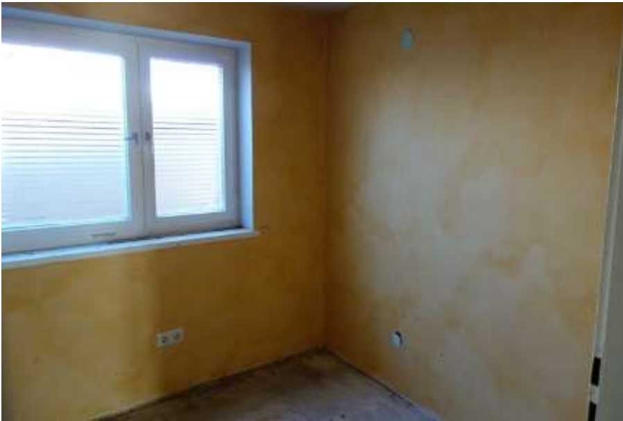
Erdgeschoss Wohnraum n. Norden m. Ausziehleiter