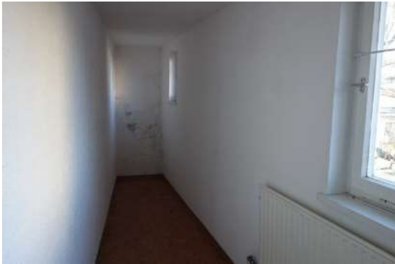
Erdgeschoss Wohnraum (m. später eingezogener Innenwand am linken Bildrand)