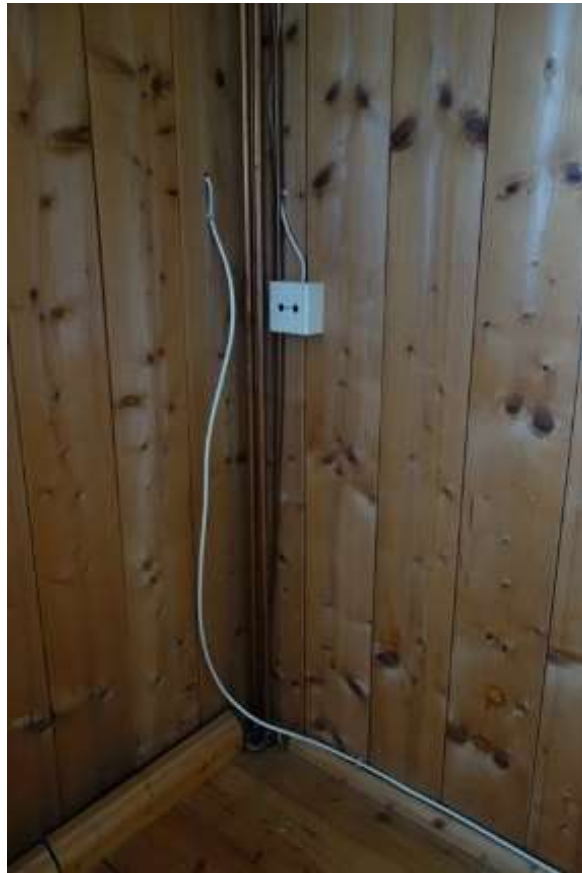
Erdgeschoss Wohnraum, Südwest, mit stillgelegtem Kachelofen