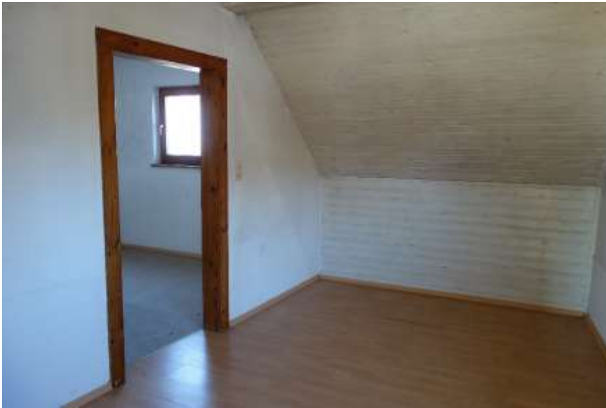
Obergeschoss Wohnraum, Fenster in d. Bereich v. 2008