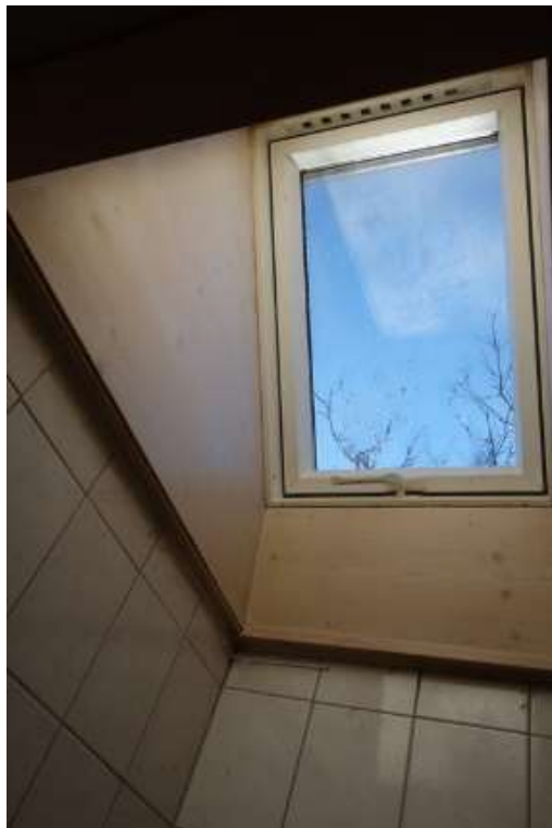
Obergeschoss weiterer Wohnraum nach Norden (Dacheinschnitt z. östlichen Anbau)