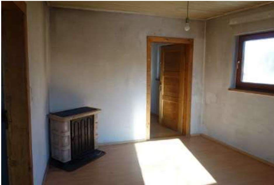
Obergeschoss Ostseite, Blick auf die Straße, die Nachbaranwesen