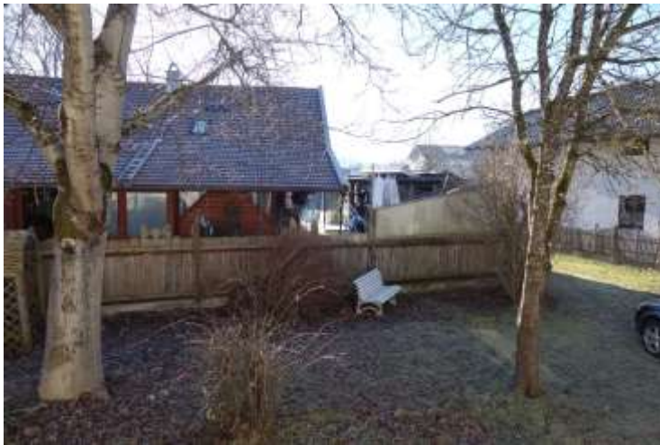
Wohnhaus Südostfassade, im Vordergrund der Anbau von 1931