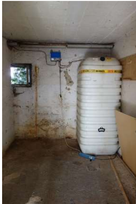
Kellerraum Mischmauerwerk (Foto aufgehellt)