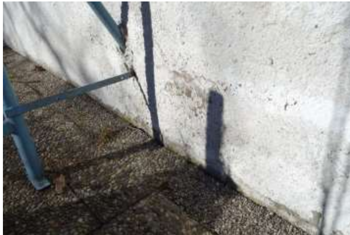
Wohnhaus, Nordostfassade mit Anbau nordseitig