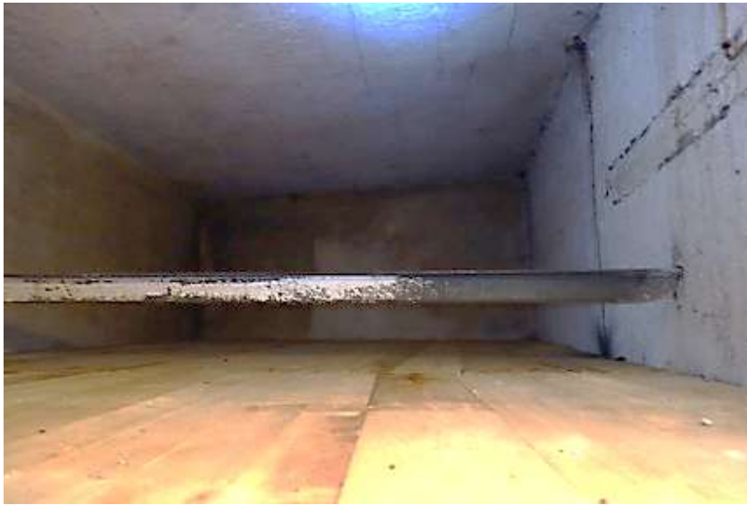
Erdgeschoss Wohnraum, Blick zum Flur