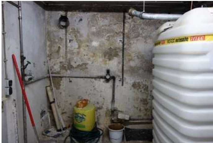
Weiterer Kellerraum mit erneuerten Wasseruhren, Leitungen teils erneuert