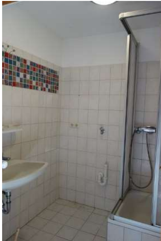
Erdgeschoss Bad, Nische unter der Treppe mit kleinem Fenster, kaum zugänglich