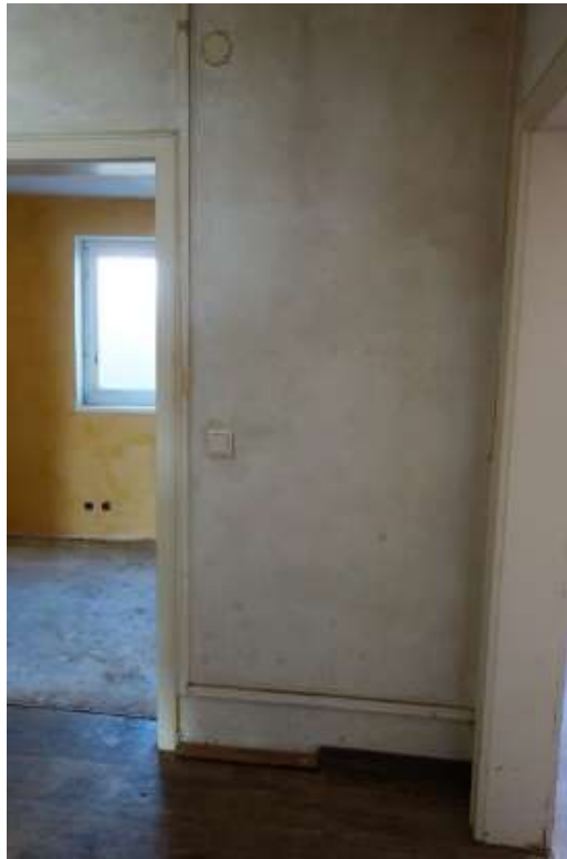
Erdgeschoss Flur, Abgang zu einem Kellerraum neben dem Eingang, Kellerraum liegt unter dem Gebäudeteil West