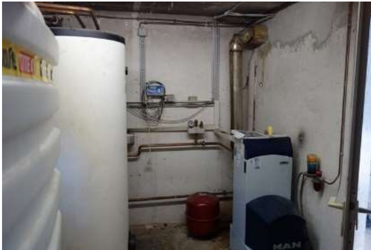
Heizraum Keller, mit Öltanks