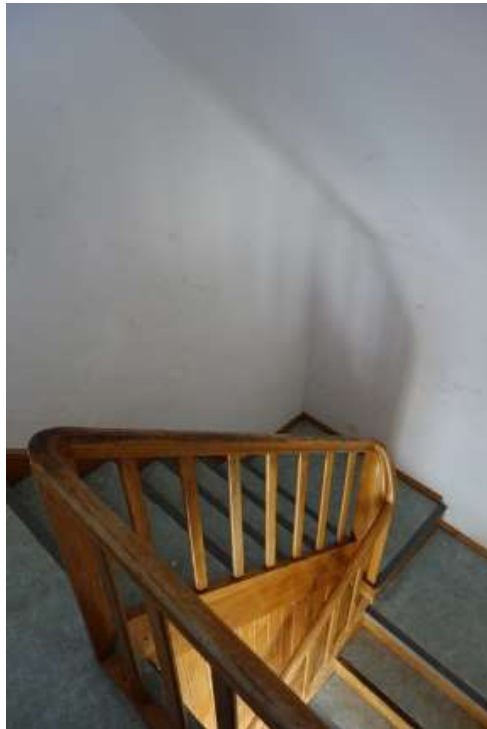
Obergeschoss Flur, Blick zum Treppenaufgang