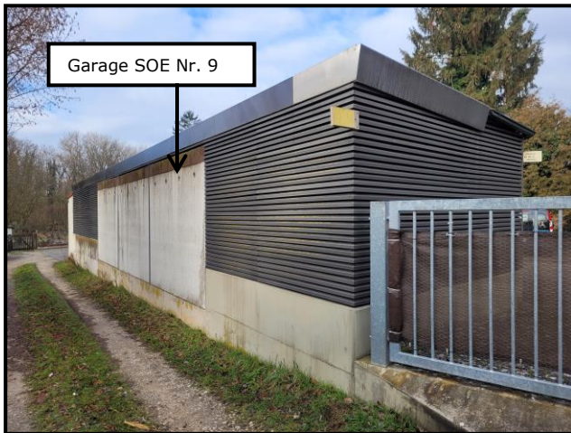
Beispiel für Objektzustand: Teilansicht vom Privatweg Flur Nr. 72