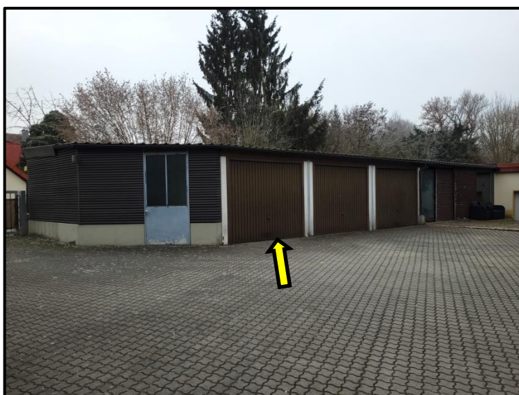
Ansicht Hofseite mit Lage der Garage SOE Nr. 9

1-fach, Auftraggeber 1-fach, Handakte des Sachverständigen