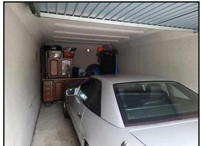
Beispiel für Innenansicht und Objektzustand: Garage SOE Nr. 9