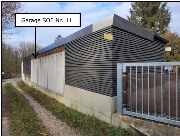
Beispiel für Objektzustand: Teilansicht vom Privatweg Flur Nr. 72