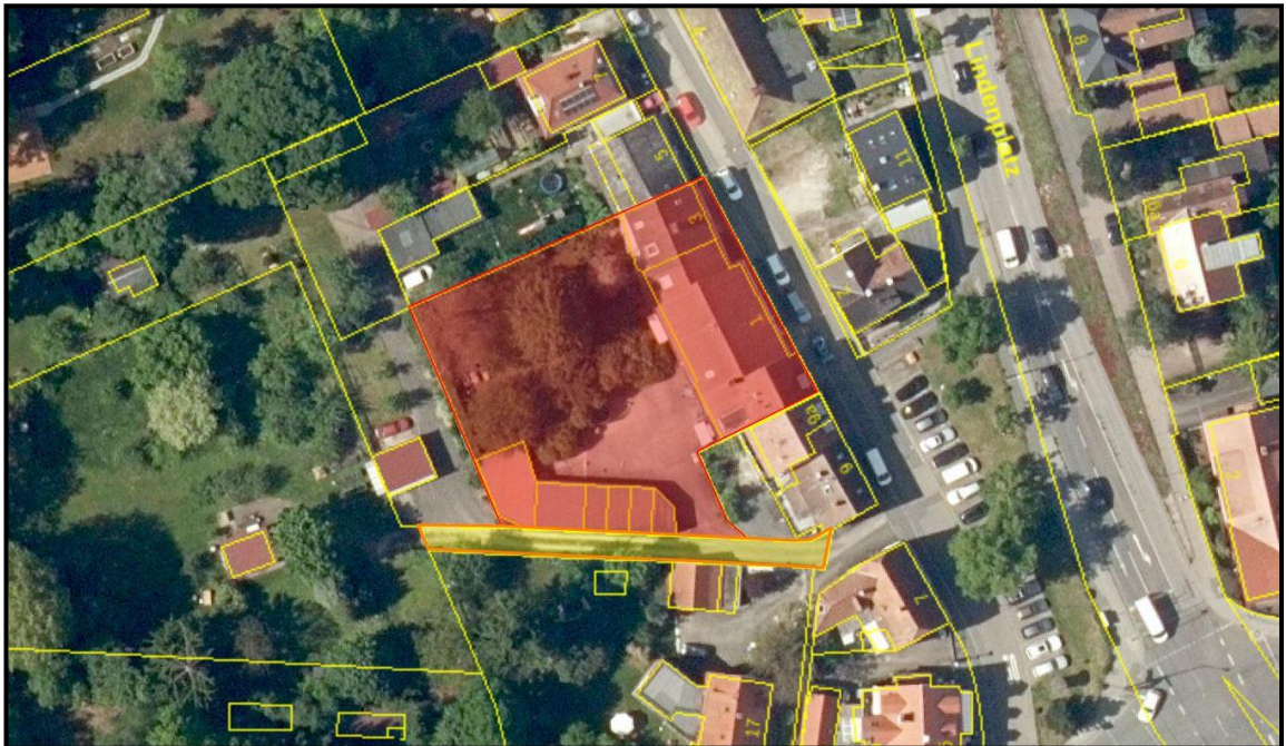
Flur Nr. 72/4 (rot unterlegt) und Privatweg Flur Nr. 72 (gelb unterlegt)

Die Garage SOE Nr. 11 und die Hofflächen (Gemeinschaftseigentum) können nur über den Privatweg Flur Nr. 72 befahren bzw. begangen werden.