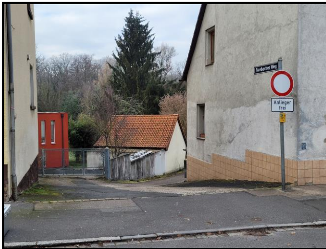
Zufahrt/Zugang über den Nasbacher Weg