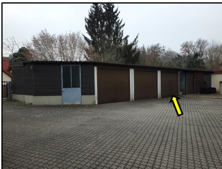
Ansicht Hofseite mit Lage der Garage SOE Nr. 11

9-fach, Auftraggeber 1-fach, Handakte des Sachverständigen