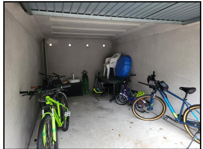
Beispiel für Innenansicht und Objektzustand: Garage SOE Nr. 11