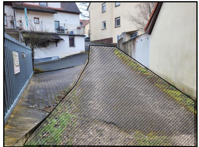
Teilansicht Privatweg Flur Nr. 72 (schraffiert)