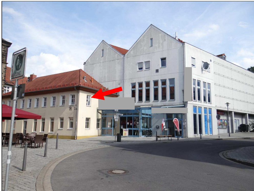
Bild 1: Blick auf das Geschäftsanwesen von Westen (SE-Nr. 3, OG Altbau)