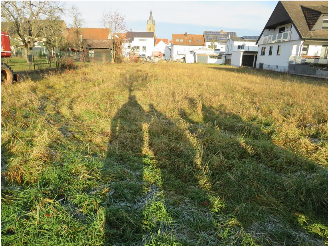
Abbildung: Ansicht von Süden (Karlstraße) in das Grundstück

Die Fläche war zum Zeitpunkt der Besichtigung in einem ungenutzten und sich selbst überlassenen Zustand. Das Grundstück ist westlich mit Sträuchern und Büschen leicht bewachsen.