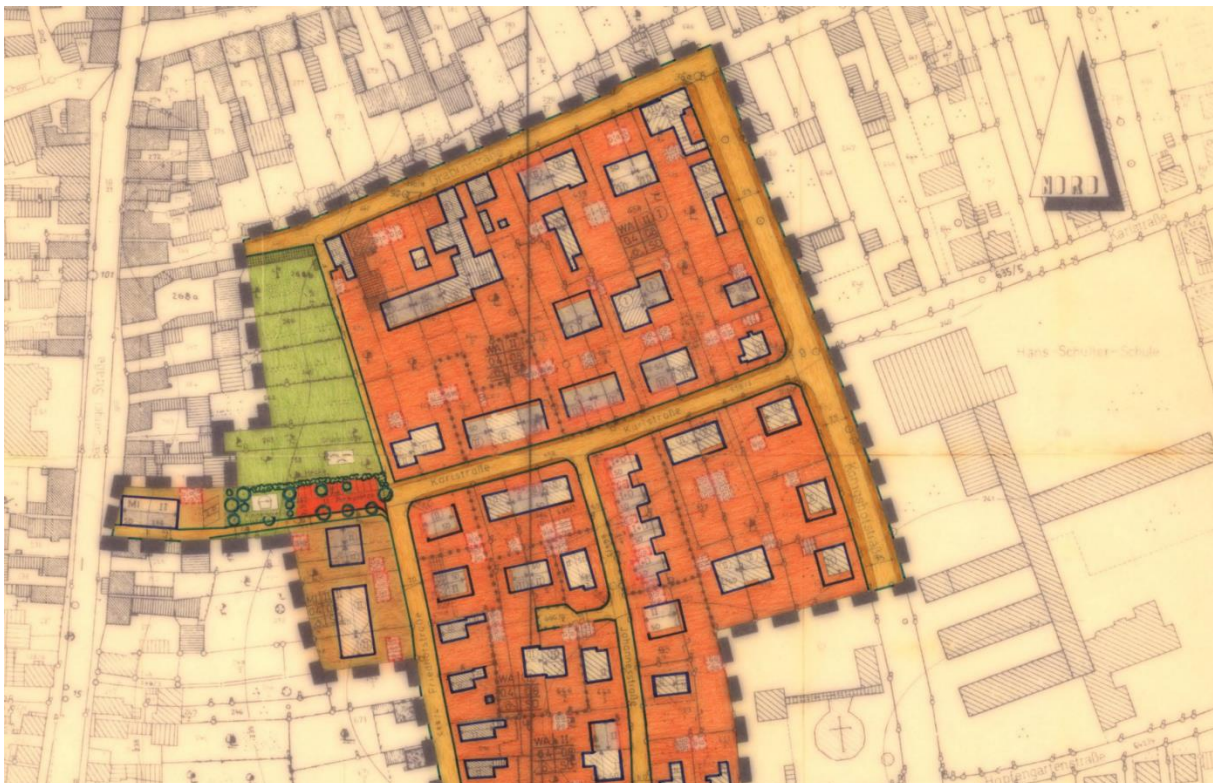
Abbildung 1 Ausschnitt aus dem Bebauungsplan " WESTL. Karlstraße"

Die zu bewertende Fläche ist im Grundbuch als Landwirtschaftsfläche ausgewiesen, befindet sich jedoch nach dem Bebauungsplan des Stadt Hallstadt „Westliche Karlstraße, 5“ vom 20. September 1979 im allgemeinen Wohngebiet (§ 4 BauNVO). Eine Nutzung als Bauland ist nach Einsichtnahme in die Bebauungspläne möglich. Ebenso kann die Fläche zur Vergrößerung der benachbarten Grundstücke beitragen. Der gültige Bebauungsplan der Stadt Hallstadt weist für die Fl.Nr. 663 eine Grundflächenzahl (GRZ) von 0,4 und eine Geschossflächenzahl (GFZ) von 0,8 aus. Desweiteren zählen zu den sonstigen verbindlichen Festsetzungen eine vorgeschriebenes Satteldach bei Wohngebäuden sowie eine eingeschränkte Bauweise (nur Einzel- und Doppelhäuser zulässig). Ebenso sind zwei Vollgeschosse im Fall einer Bebauung erforderlich.